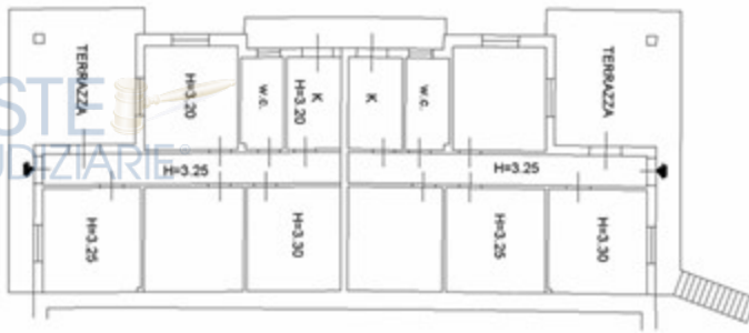
ASTE GIUDIZIARIE ASTE GIUDIZIARIE PIANO TERRA CORPO 1 "B"