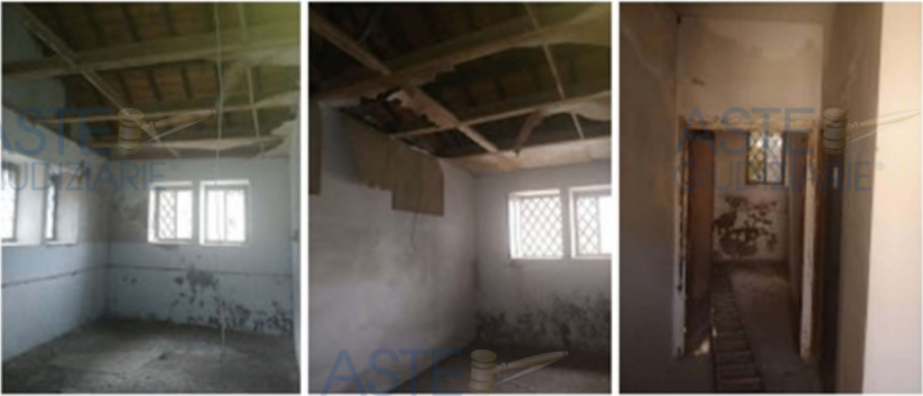
Corpo B1 interno al fgl 53 part.lla 18 sub 4