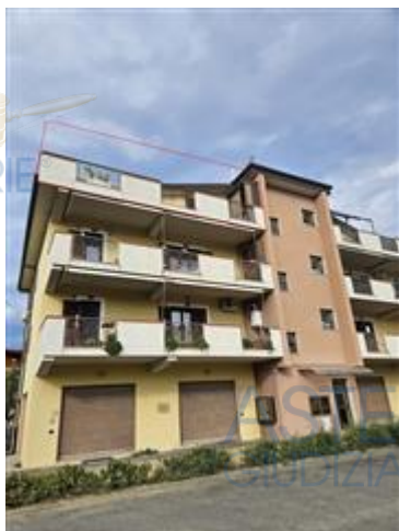
Foto 1 - Esterni con indicazione appartamento

L'intero edificio sviluppa 5 piani, 4 piani fuori terra, 1 piano interrato. Immobile costruito nel 2008.