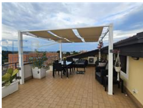
Foto 1 - Tettoia su terrazzo

Tempi necessari per la regolarizzazione: 30