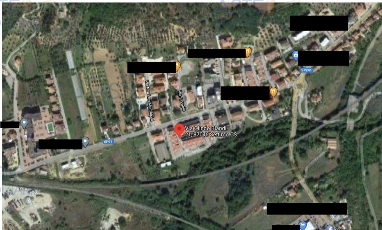
Figura 1 – Vista dall’alto del complesso immobiliare

Il corpo di fabbrica è stato realizzato negli anni Duemila, con strutture portanti in conglomerato cementizio armato; esternamente presenta un buono stato di manutenzione. Le tamponature perimetrali ed i tramezzi interni sono rifiniti con intonaco civile tinteggiato. L’accesso al portoncino condominiale avviene dal lato Ovest della costruzione.