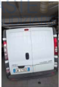
EW 175 GG (4)