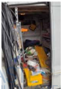
EW 175 GG (3)