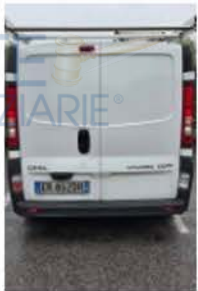
ER 892 DH (5)