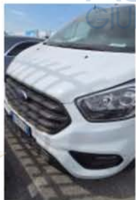
GF 770 LX (3)