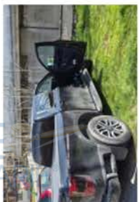
GV 886 XB (1)