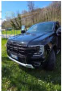
GV 886 XB (4)