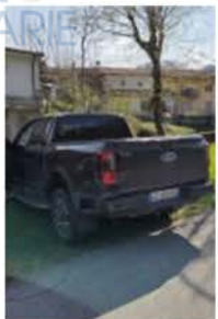
GV 886 XB (2)