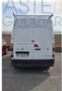
FA 946 CY (4)