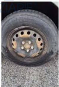
ER 892 DH (3)