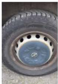
FA 946 CY (2)