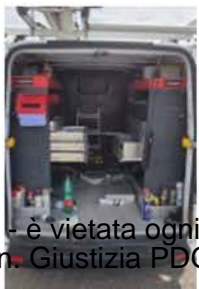
GF 770 LX (6)