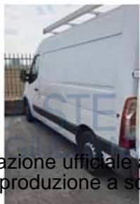
FA 946 CY (1)