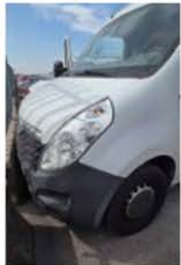
FA 946 CY (5)