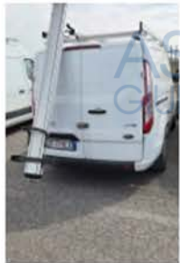
GF 770 LX (5)