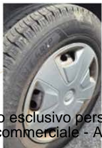
GF 770 LX (1)