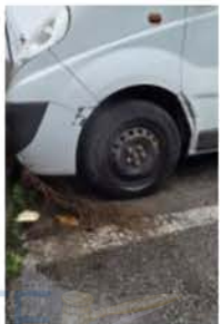
ER 892 DH (4)