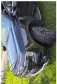
GV 886 XB (3)