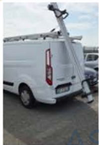
GF 770 LX (4)