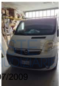
EW 175 GG (1)