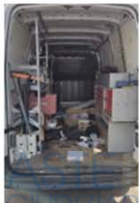
FA 946 CY (3)