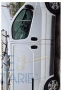
ER 892 DH (2)