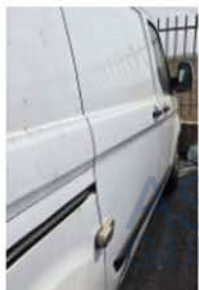
GF 770 LX (2)