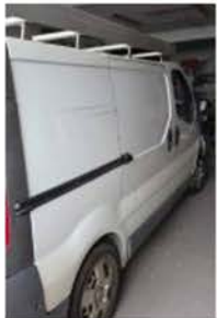
EW 175 GG (5)