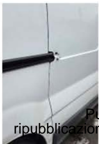
ER 892 DH (1)