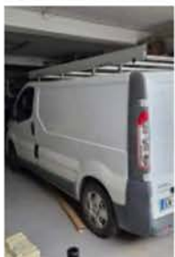
EW 175 GG (2)