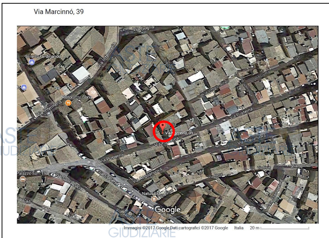
Inquadramento territoriale (fotografia aerea tramite google earth)

Al fine di permetterne l'individuazione si allega il link della precedente immagine :