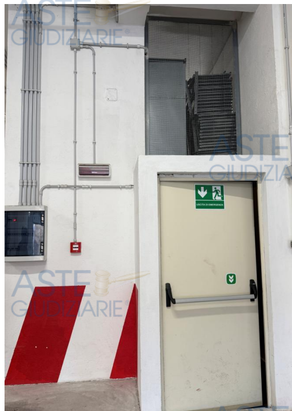
Vista dall'esterno del vano ascensore