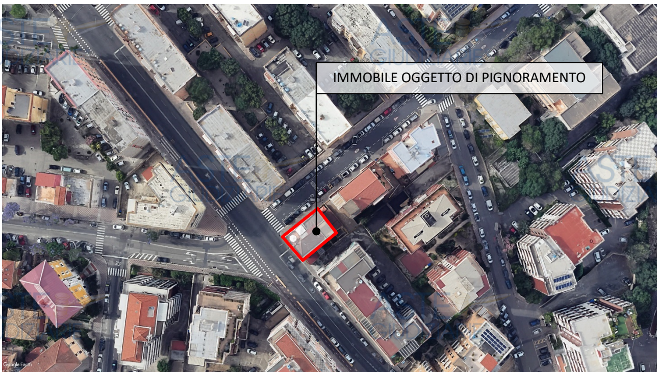
Figura 2. Inquadramento territoriale dell'immobile oggetto di pignoramento

Il bene oggetto di pignoramento è ubicato in via Venezia n°5, piano secondo, Cagliari.