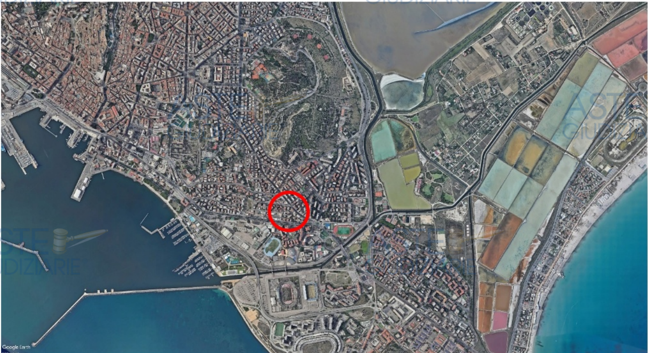
Figura 1. Inquadramento territoriale dell'immobile oggetto di pignoramento

Unità residenziale sita in Cagliari, via Venezia n.5, piano secondo, distinta al N.C.E.U. di Cagliari al foglio A/21, Particella 188, subalterno 6, categoria A/3, classe 2, consistenza 3,5 vani, rendita € 289,22.