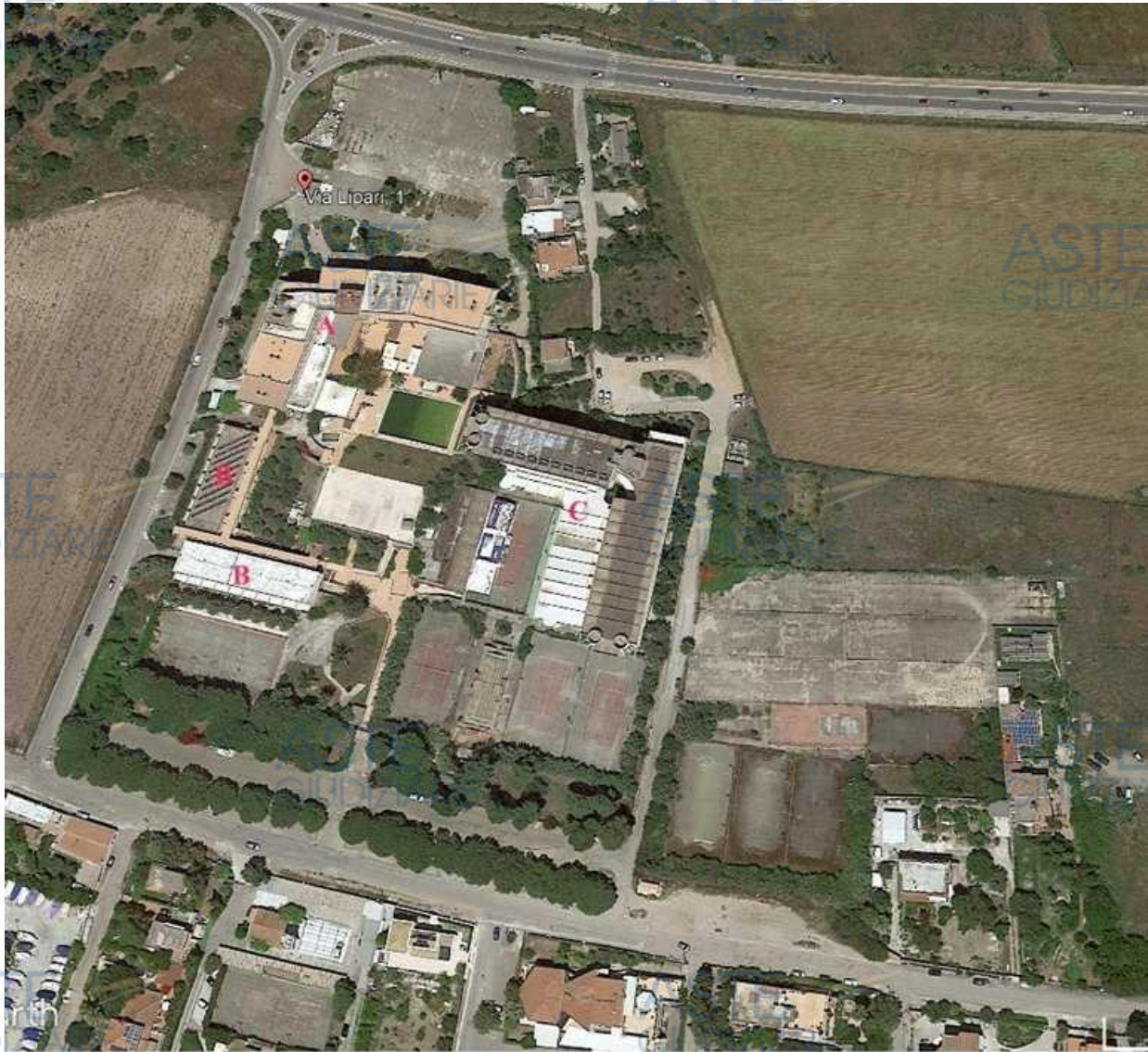
FOTO AEREA DEL COMPLESSO ALBERGHIERO