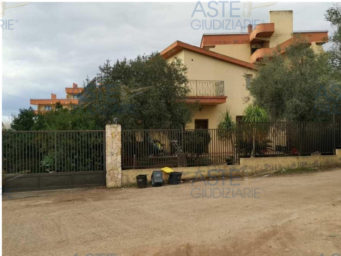
Foto della villa unifamiliare con vista dalla viabilità in sterrato a servizio del [REDACTED]