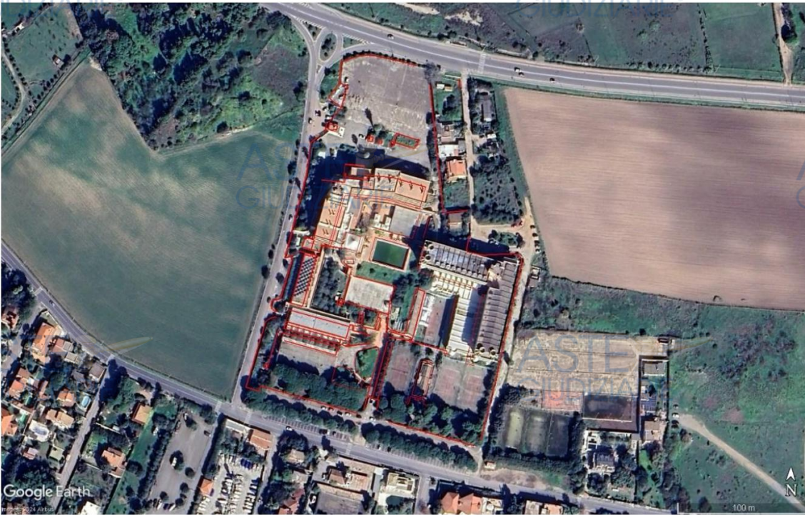
Fig. 3 – Sovrapposizione rilievo su immagine satellitare tratta dal sito Google Earth.

Nelle immagini 2 e 3 è di più immediata comprensione quanto su scritto.