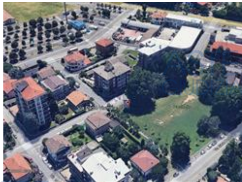
Vista aerea del condominio