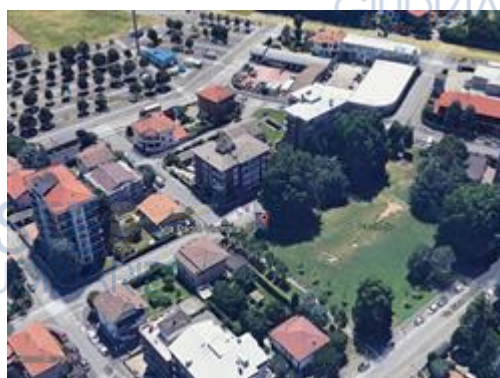
Vista aerea del condominio