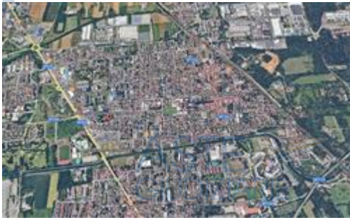
inquadramento nel territorio comunale