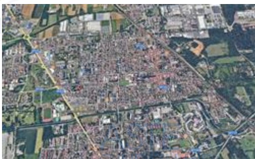
inquadramento nel territorio comunale