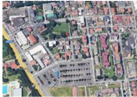
inquadramento nel quartiere