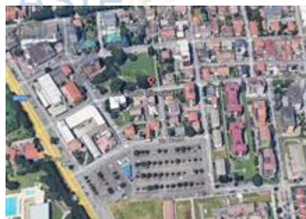
inquadramento nel quartiere