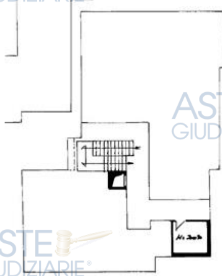
stralcio planimetria catastale