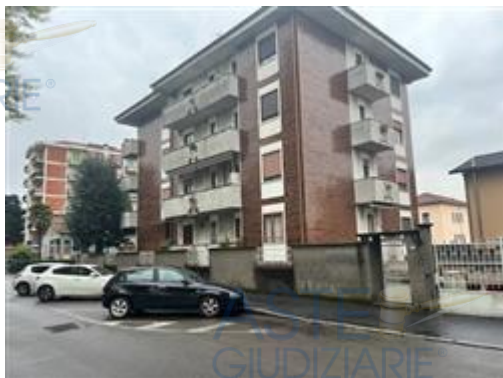
vista esterna condominio

L'intero edificio sviluppa 5 piani, 4 piani fuori terra, 1 piano interrato. Immobile costruito nel 1984.