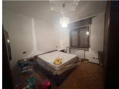
camera da letto