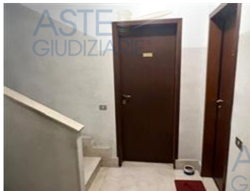
ingresso da scala condominiale