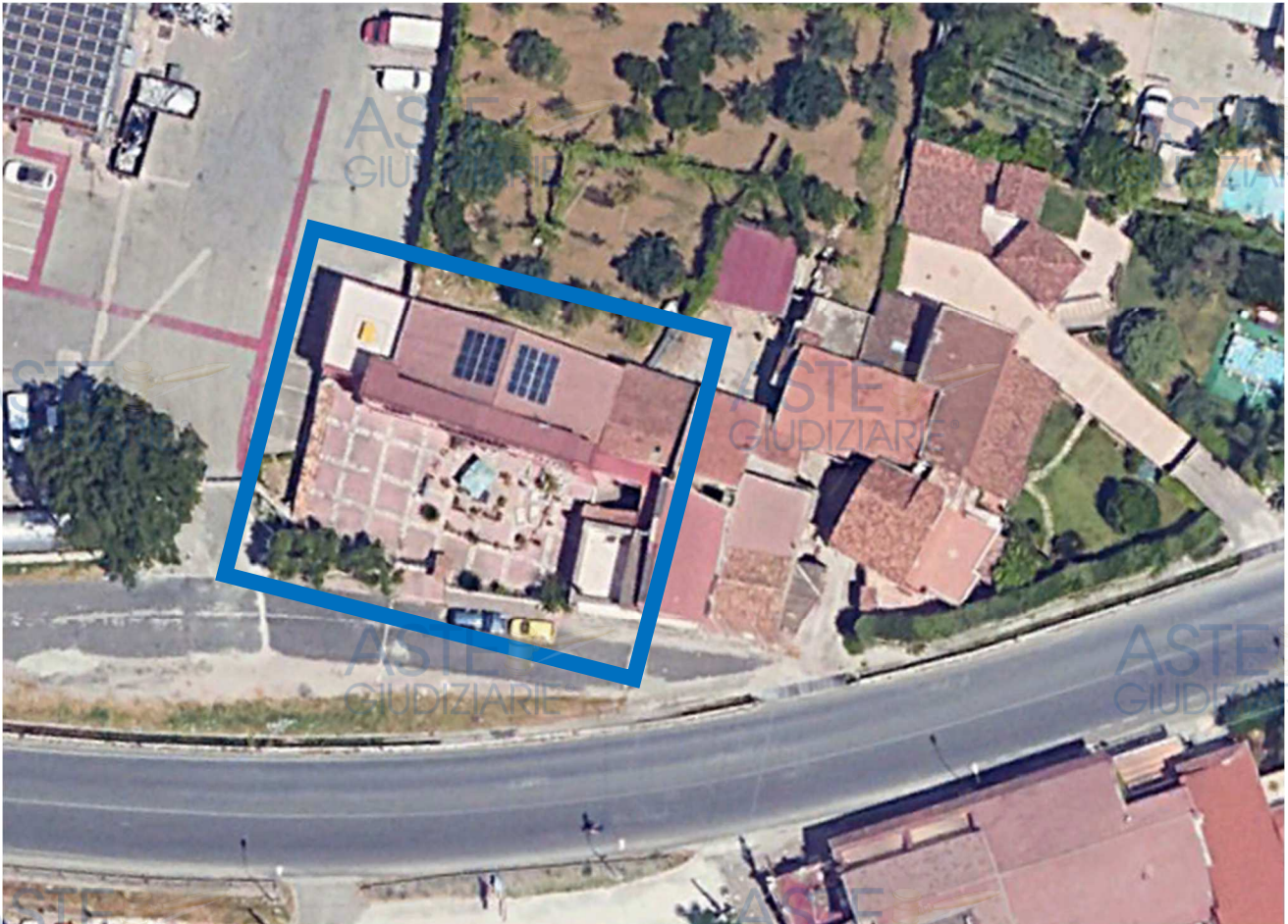
Vista di dettaglio

Nelle sottostanti ortofoto è possibile individuare il fabbricato nel contesto territoriale.