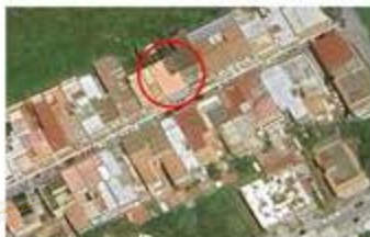
Fabbricato in oggetto