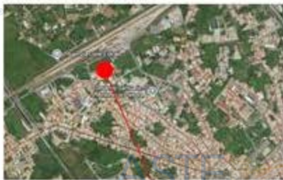
Via Sebastiano Crinò n. 21 Barcellona Pozzo di Gotto (ME)