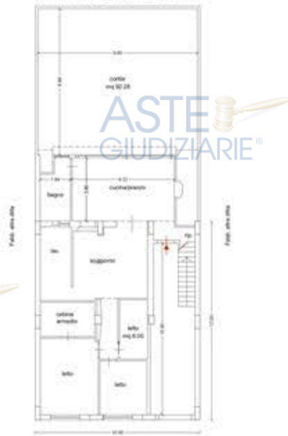
Planimetria dello stato di fatto - Piano Terra