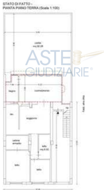
Planimetria dello stato di fatto - Piano Terra