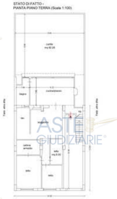
Planimetria dello stato di fatto - Piano Terra

L'immobile risulta non conforme, ma regolarizzabile . Tempi necessari per la regolarizzazione: 90