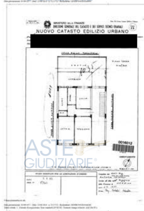
Planimetria catastale - Agenzia delle Entrate, Ufficio del Territorio - Catasto di Messina