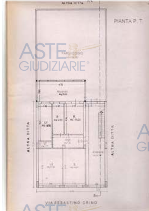
Planimetria autorizzata con C.E. in sanatoria n. 40 - 2011