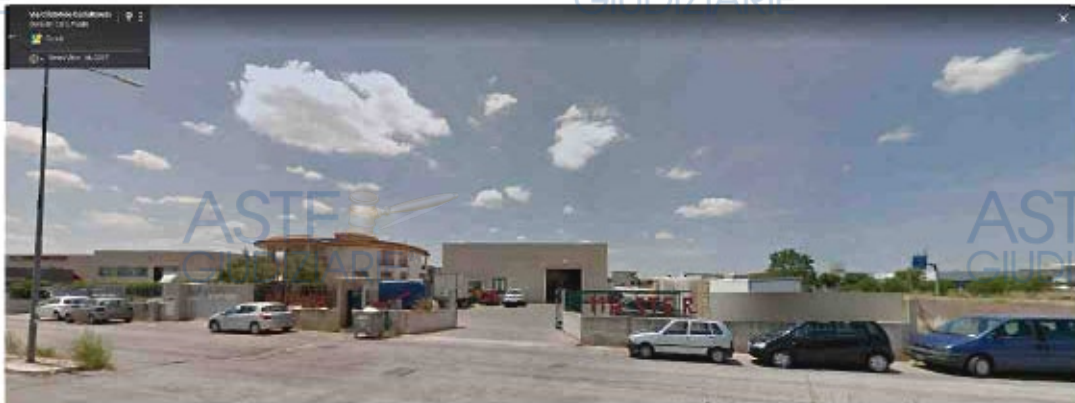
Figura 1 - Ingresso capannone [redacted] srl

L'ufficio dopo una preliminare ricognizione dei luoghi e dei beni ubicati all'interno dell'immobile, costituito da un capannone industriale adibito, tra l'altro, a lavorazione, trasformazione, refrigerazione di prodotti ortofrutticoli procedeva alle operazioni di inventario dei beni. Le foto che seguono inquadrano l'immobile di che trattasi.