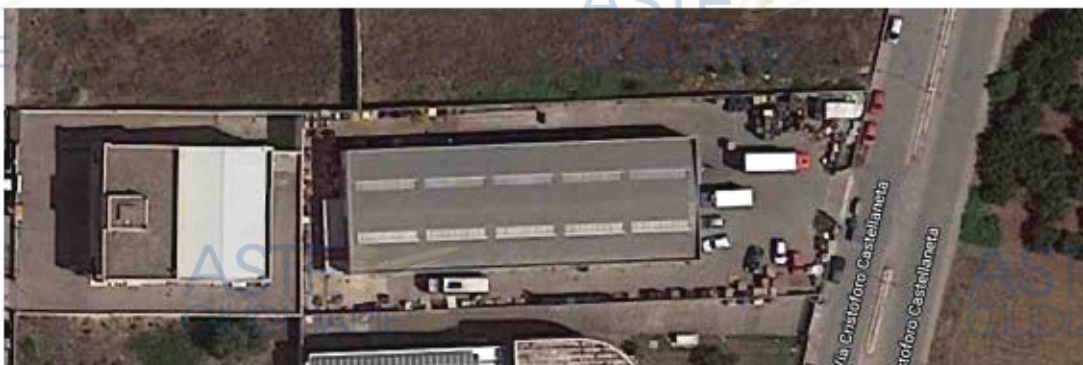
Figura 2 – Vista dall'alto del capannone [redacted] srl

In data 26/07/2021 i Curatori Fallimentari trasmettevano a mezzo pec (cfr. ALL.2) il verbale di inventario ed allegati con invito a procedere alla relativa valorizzazione.