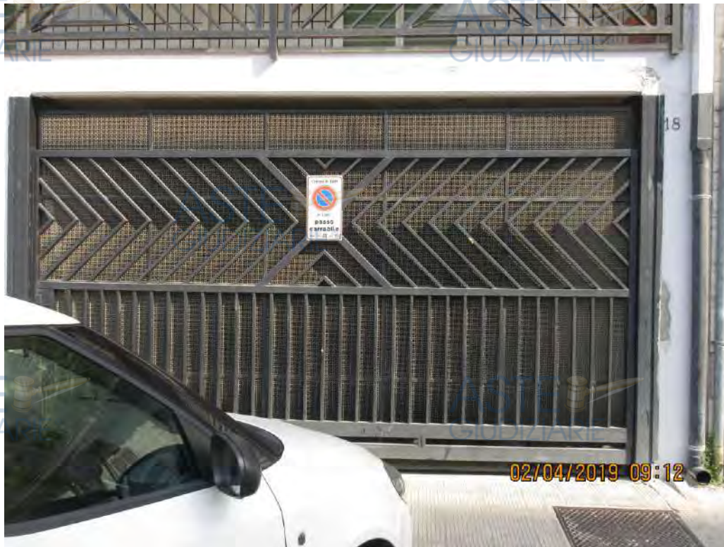
ASTE Foto n.18