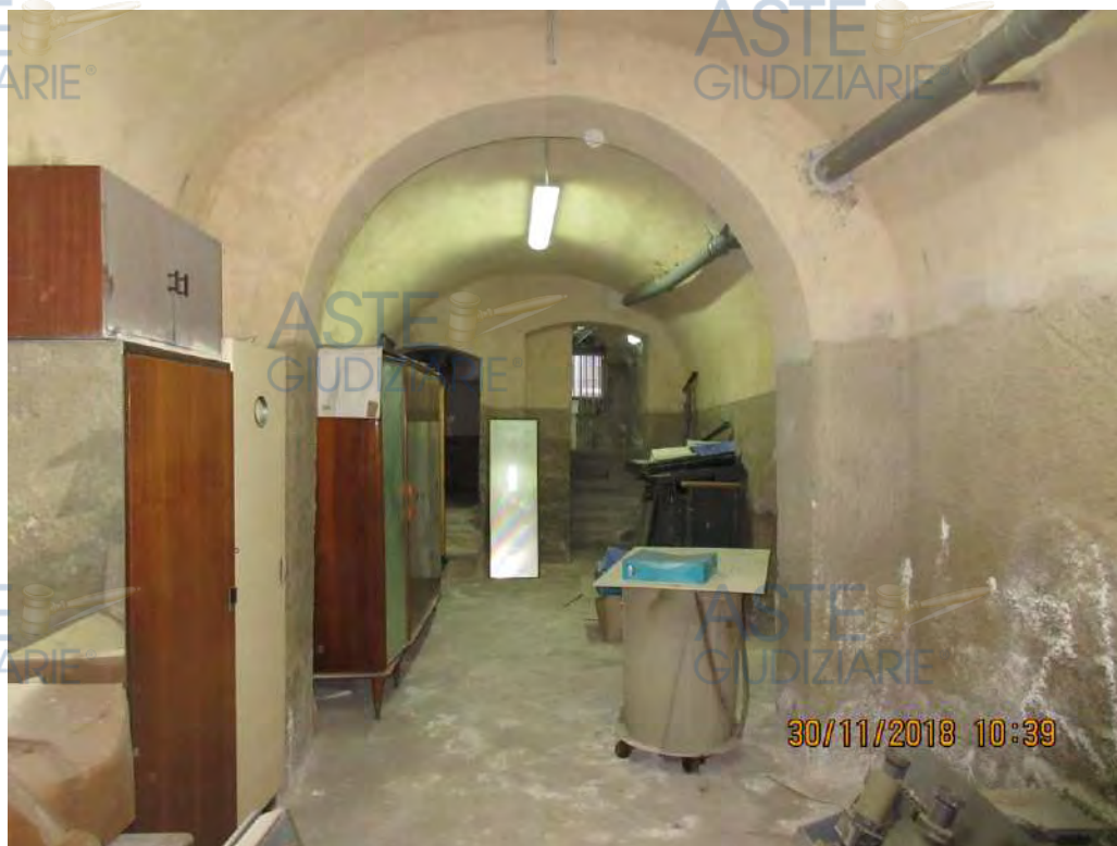
ASTE GIUDIZIARIE Foto n.90

Vista dell' ampliamento del sub 6 NON documentato catastalmente