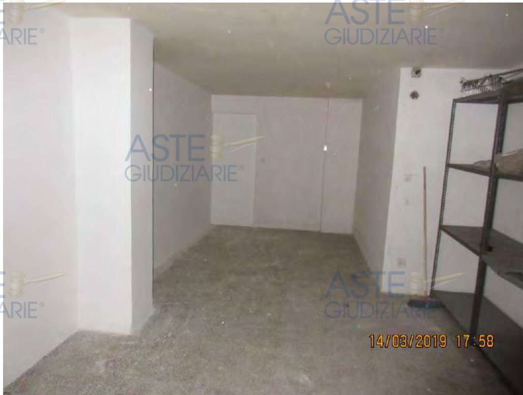
ASTE GIUDIZIARIE Foto n.64