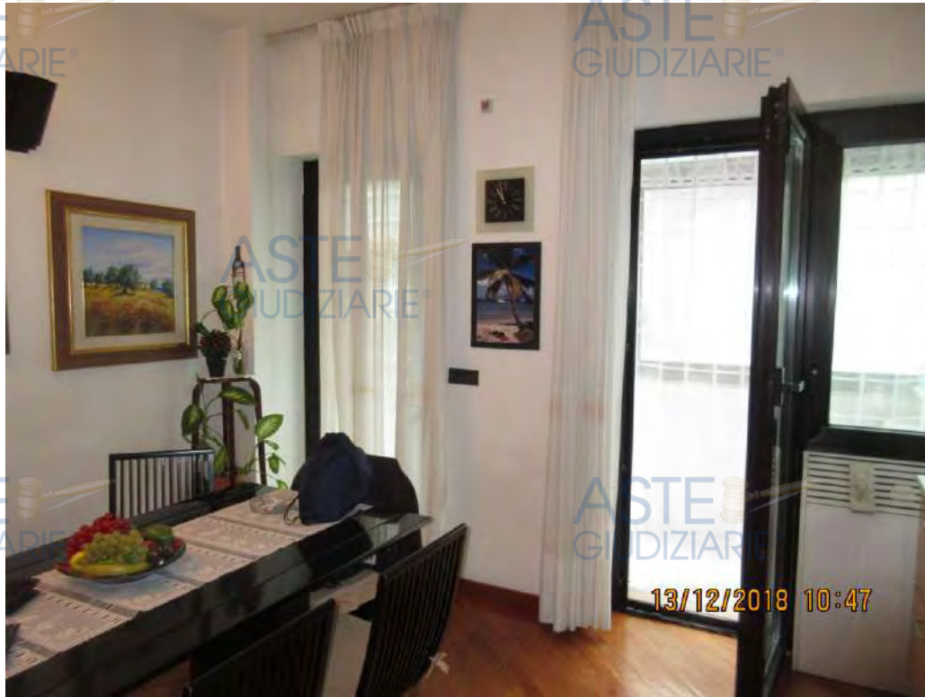
ASTE GIUDIZIARIE® Foto n. 99