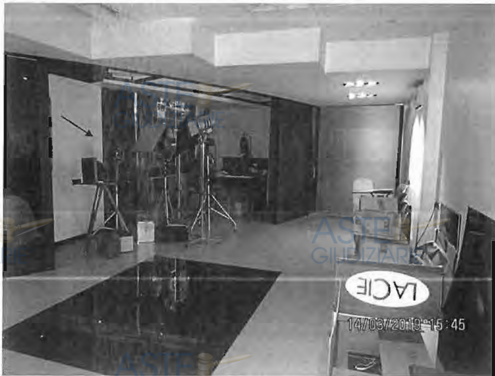
Foto n.2 Con la freccia nera si indica la zona di accorpamento del balcone nell'immobile

Con riferimento a tale immobile , realizzato ab origine ante 1967 , il ctu ribadisce che NON è stato possibile rintracciare e/o al momento NON è disponibile presso il Comune di Bari la concessione edilizia originaria del fabbricato.