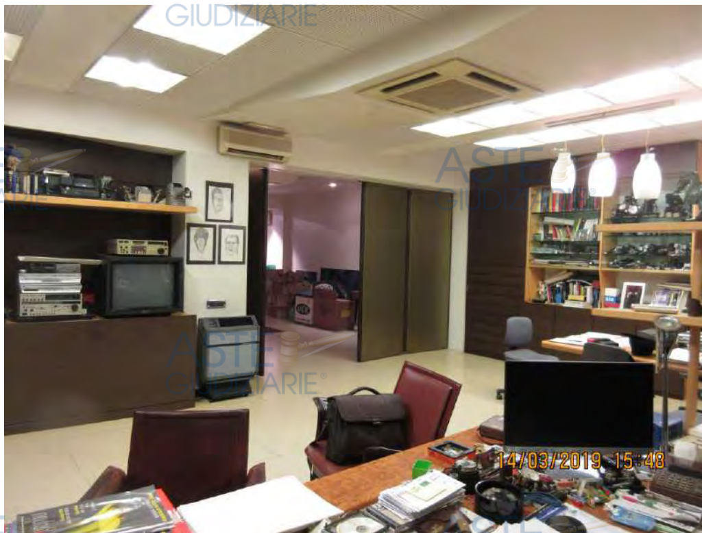
Foto n.13 Grande ufficio