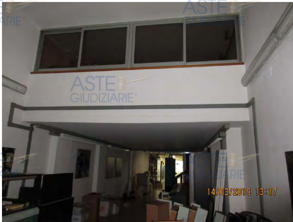
ASTE GIUDIZIARIE® Foto n.33