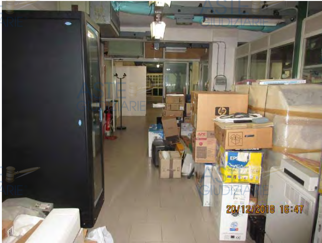
ASTE GIUDIZIARIE Foto n.36