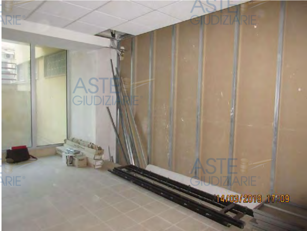
ASTE GIUDIZIARIE® Foto n.4