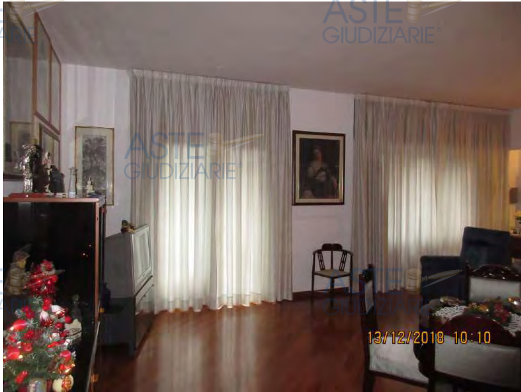
ASTE GIUDIZIARIE Foto n.95