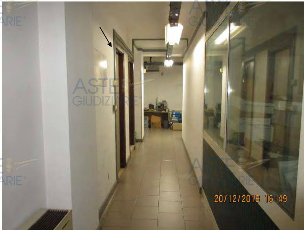
Foto n.38 Corridoio trasversale di collegamento con indicazione sulla sinistra e con freccia della porta di accesso al piano interrato