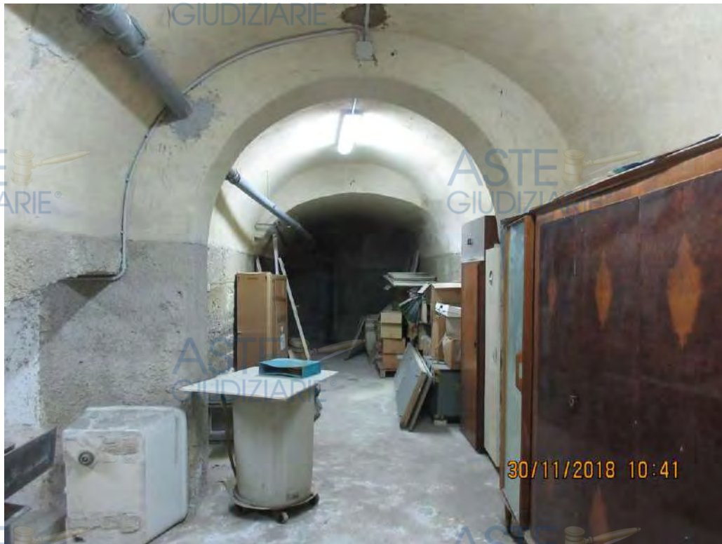
ASTE GIUDIZIARIE Foto n.89

Vista dell'ampliamento del sub 6 NON documentato catastalmente