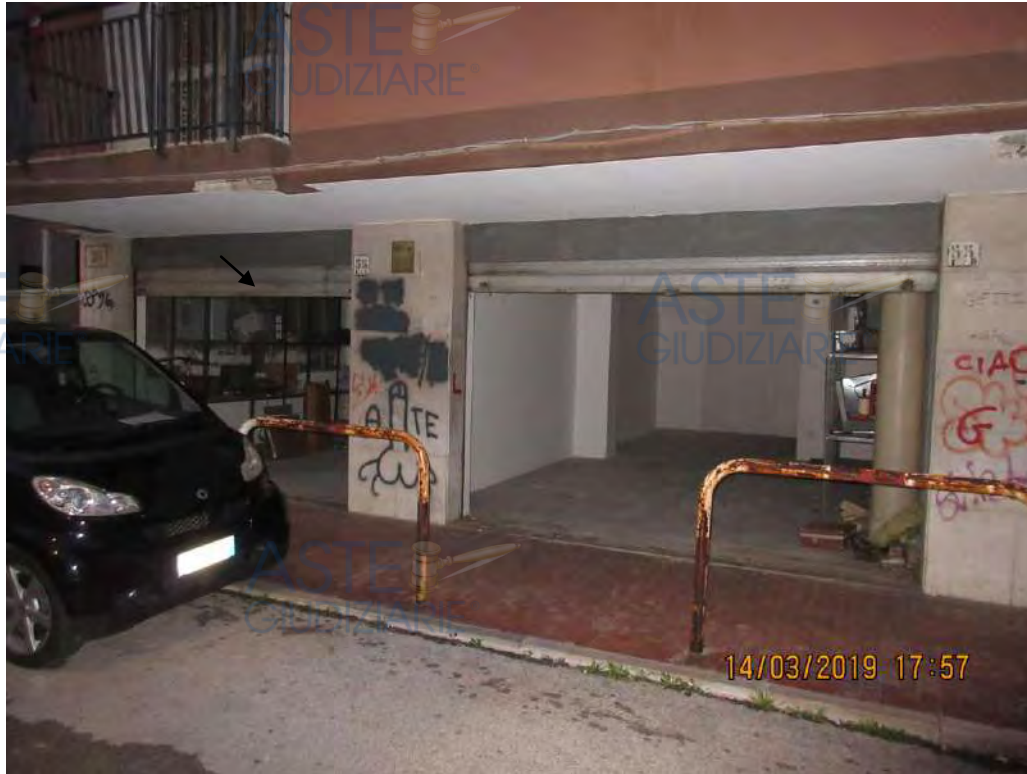
Foto n.57 e 58 Immobile in oggetto è quello a sinistra indicato con freccia

Rappresentazione fotografica del locale ad uso deposito Livello stradale Foglio n.112 particella 672 sub 31 Trav. Via Cagnazzi n. 55 I/ C Bari