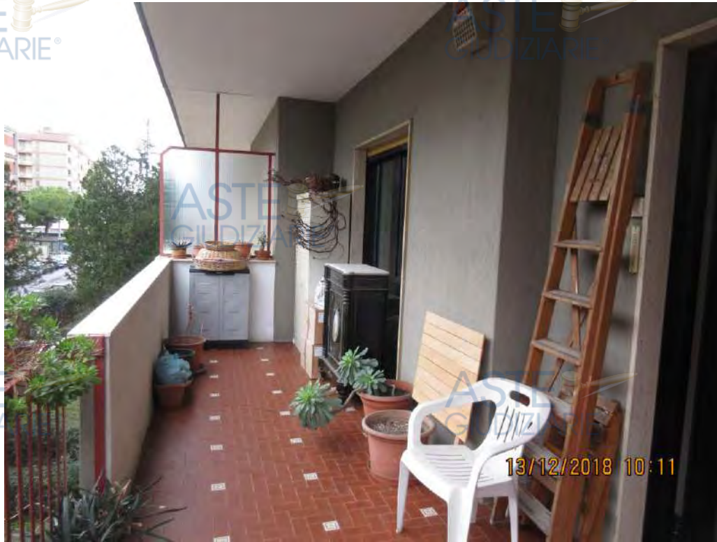
ASTE Foto n.97