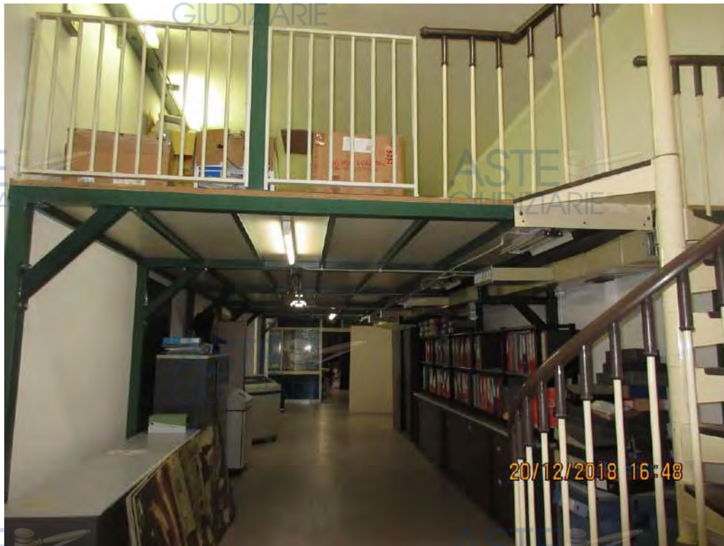
ASTE GIUDIZIARIE Foto n.43

Seconda Zona soppalcata NON oggetto di autorizzazione e non sanabile