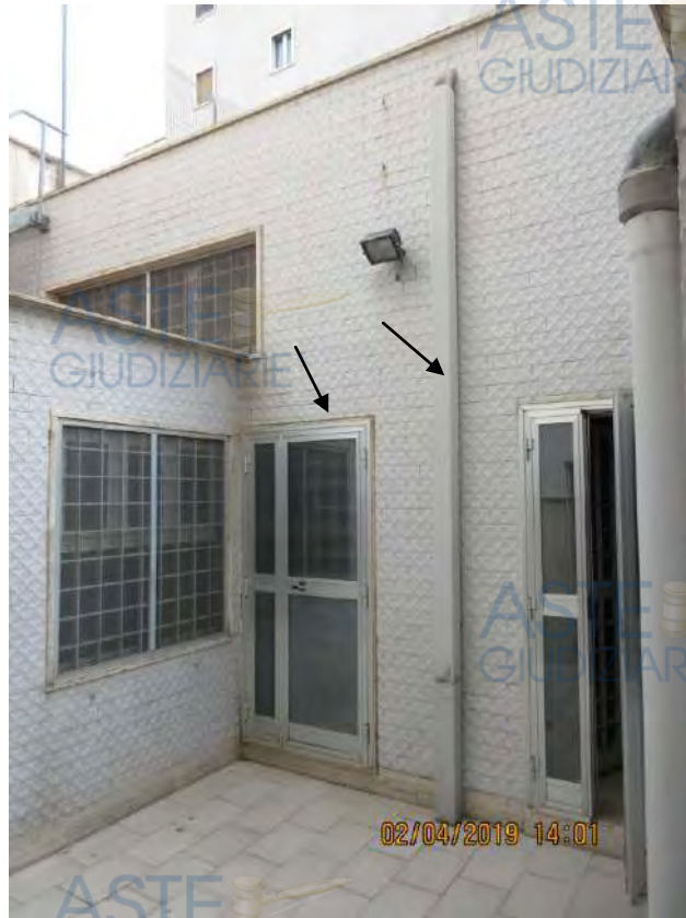
Foto n. 68 Ingresso nel subalterno n.1 (a sinistra indicato con la freccia nera)

Il pluviale rappresenta l'asse di simmetria ideale dell'immobile attuale