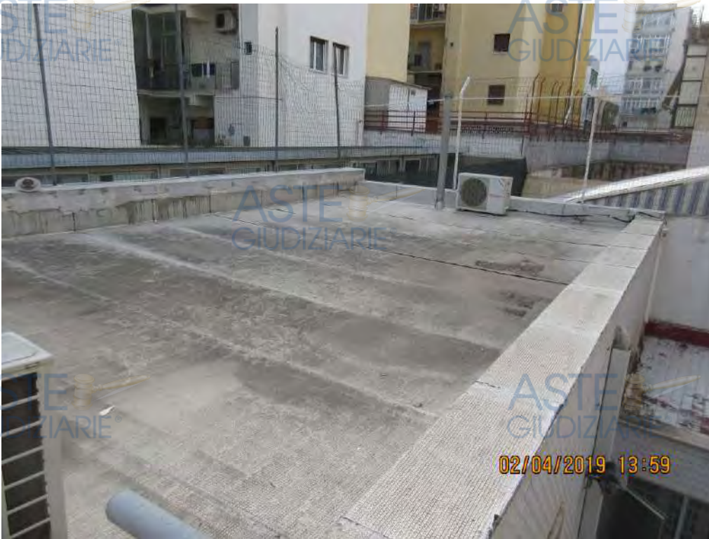
Foto n.77 Impermeabilizzazione della copertura dell'immobile