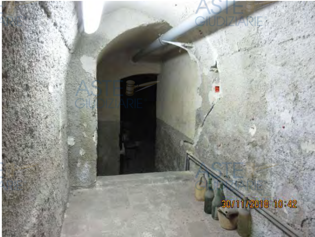
ASTE GIUDIZIARIE Foto n.88