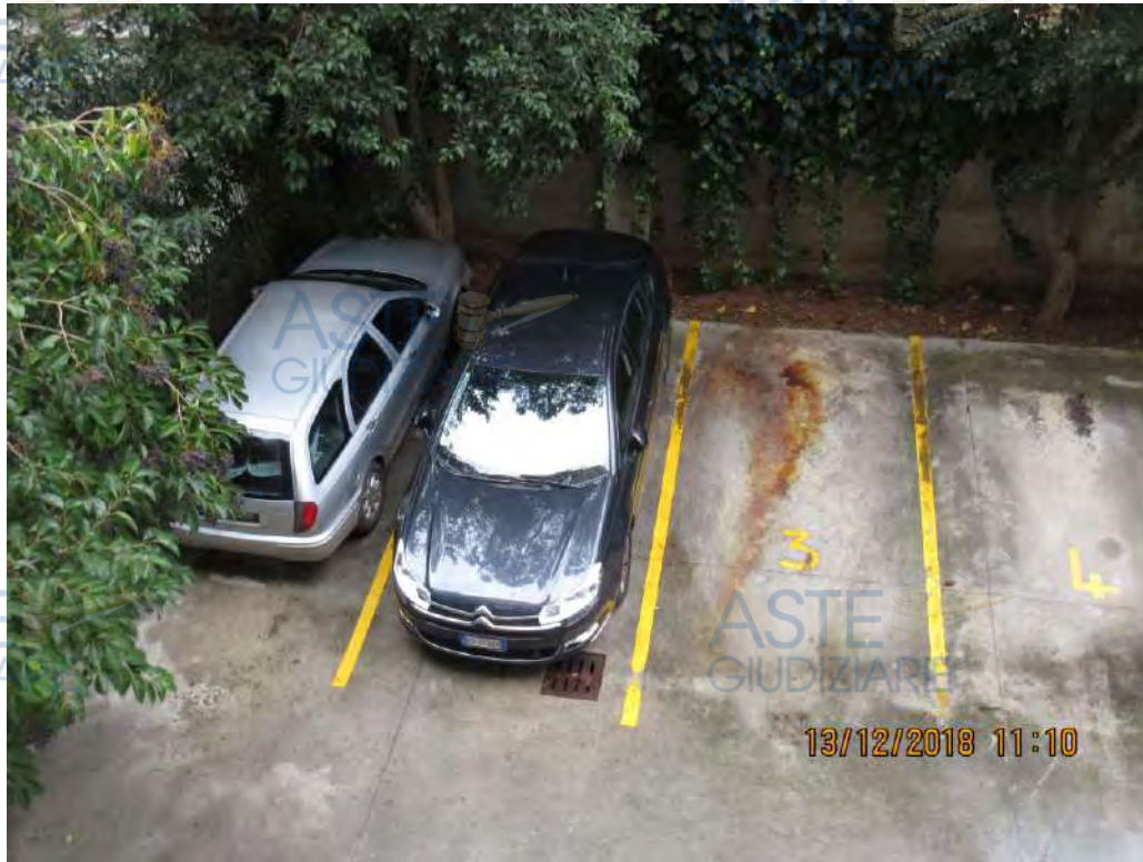
ASTE GIUDIZIARIE® Foto n.105