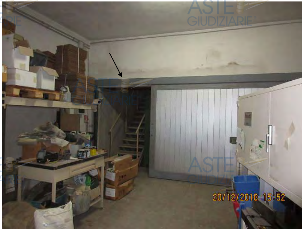
ASTE GIUDIZIARIE Foto n.20

Ingresso nell'autorimessa da un altro immobile NON oggetto di tale procedura