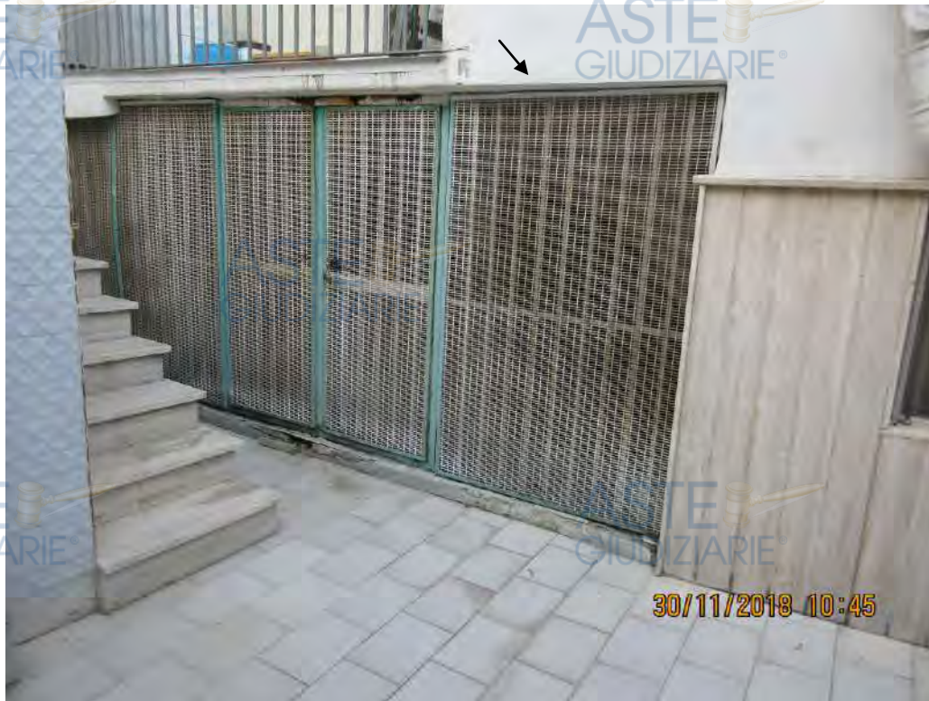
Foto n. 83 Ingresso