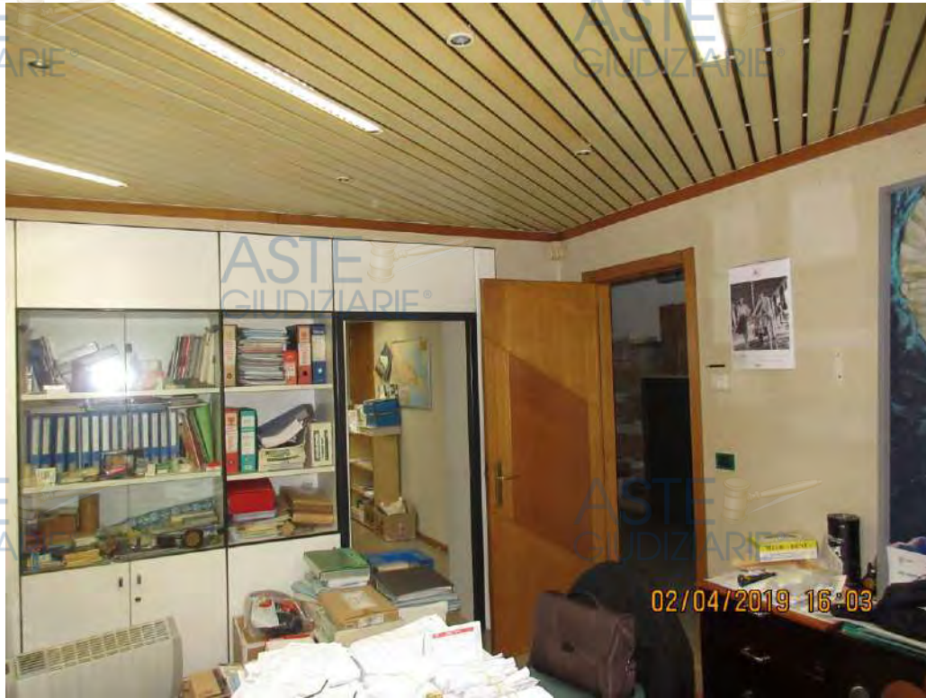
ASTE GIUDIZIARIE® Foto n.30