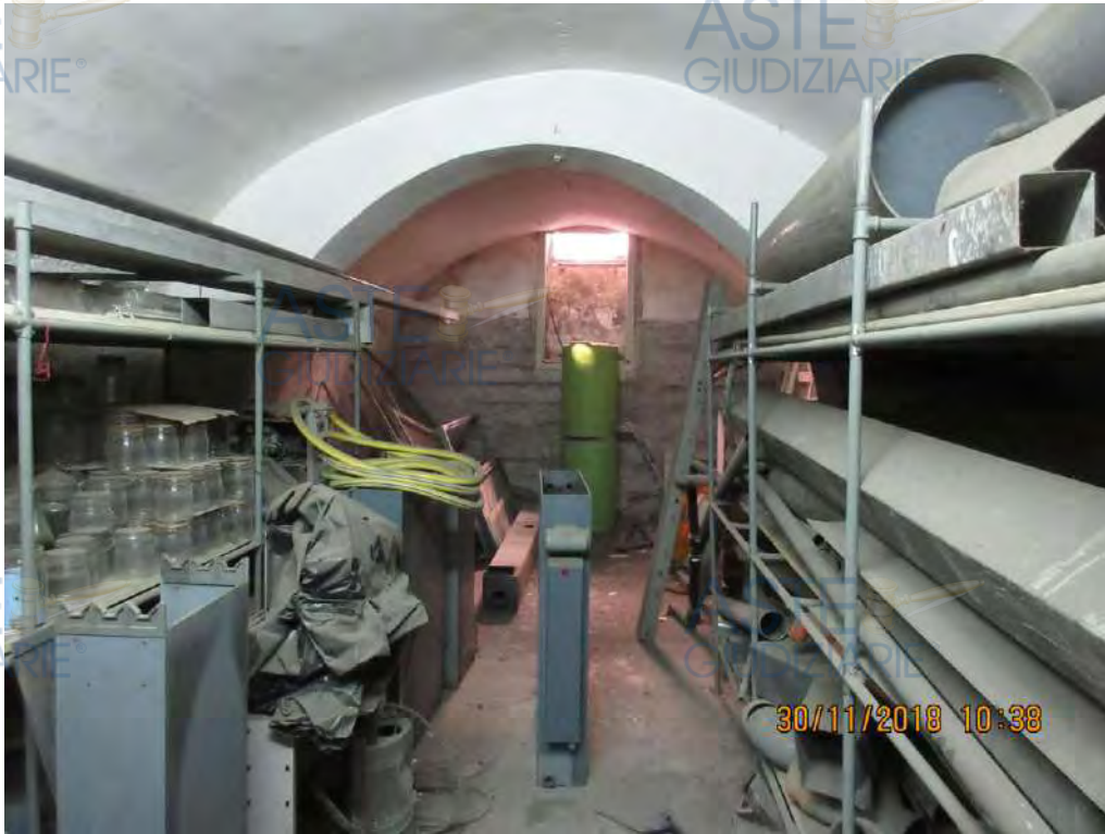
Foto n.85 Sub 7 Con finestra frontale prospiciente la Via Podgora