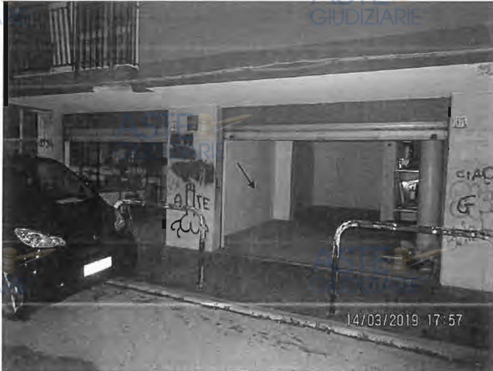
Foto n.5 Vista di insieme dei n. 2 locali box sub n. 31 e 32 con il tramezzo divisorio