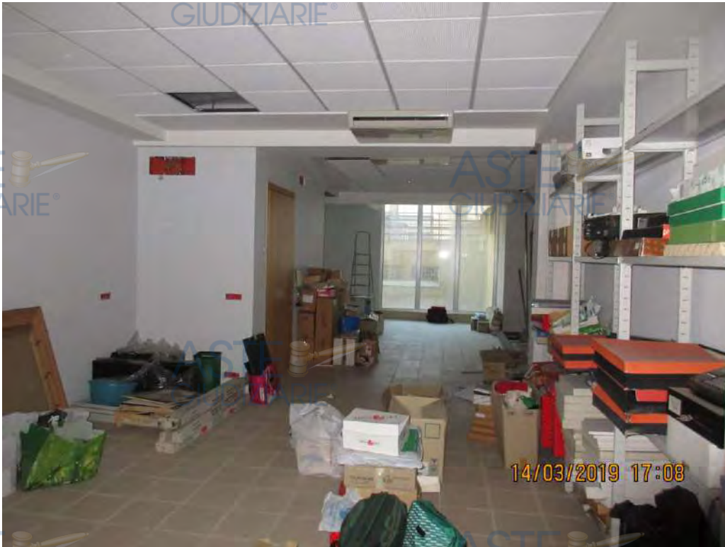
ASTE GIUDIZIARIE® Foto n.5