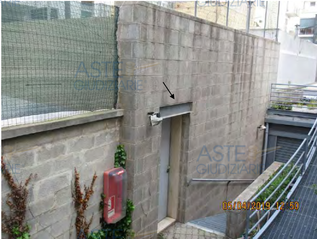
Foto n.70 Altro ingresso raggiungibile dall'interno di un altro immobile, attualmente di proprietà degli stessi debitori