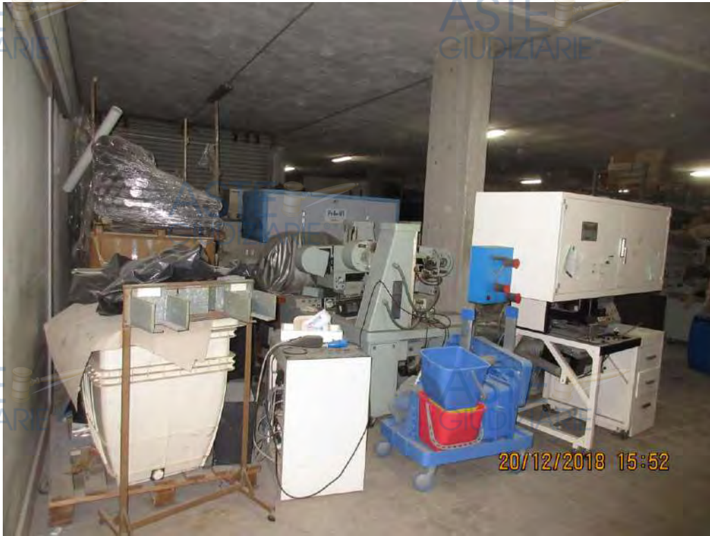
ASTE GIUDIZIARIE Foto n.22