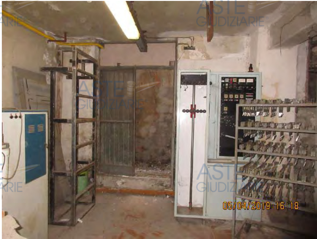
ASTE GIUDIZIARIE Foto n.53