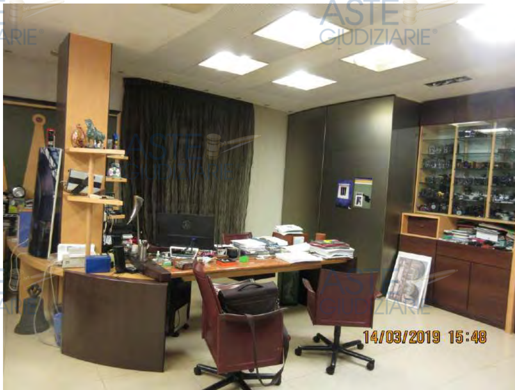
Foto n.12 Grande ufficio