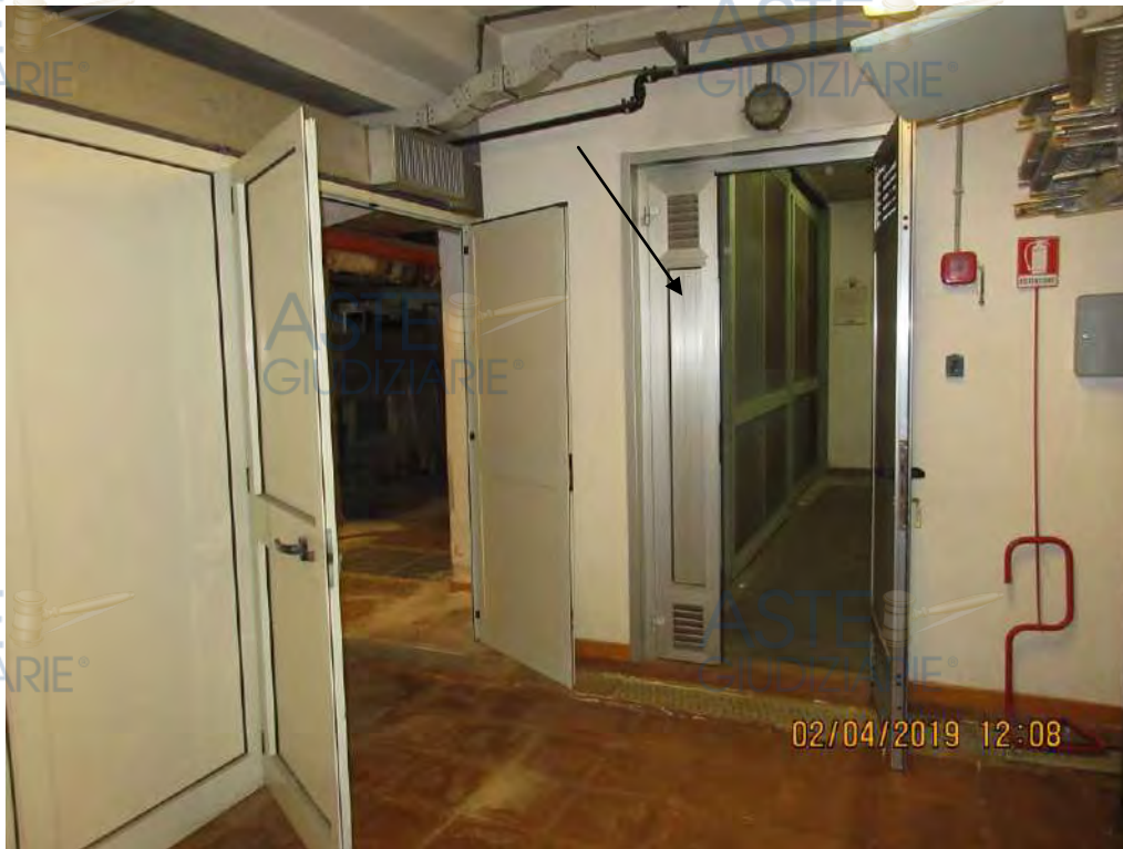
Foto n. 51 Ingresso frontale nella cabina elettrica di trasformazione