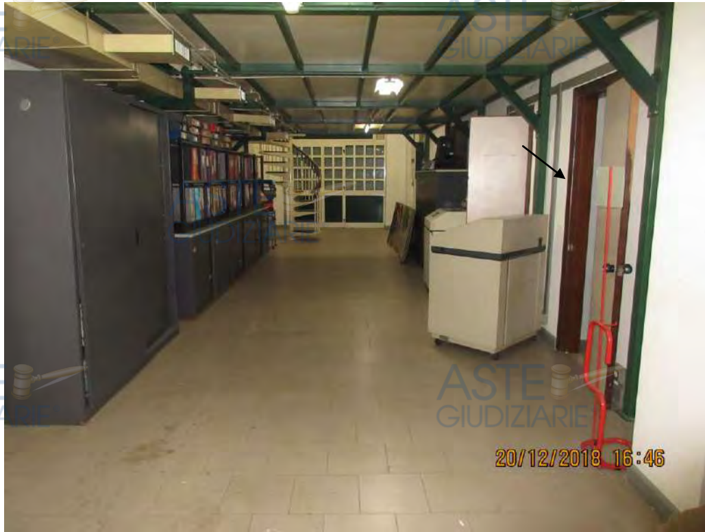
ASTE GIUDIZIARIE Foto n.42