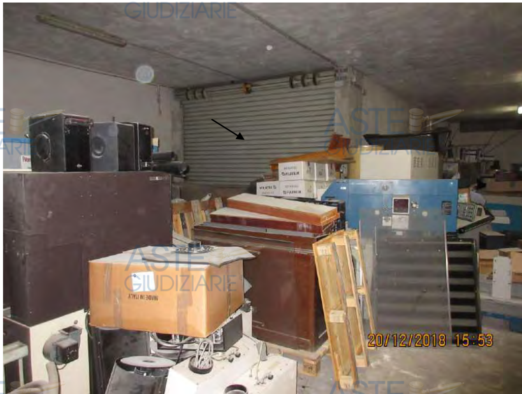
Foto n. 19 Ingresso nell'autorimessa dalla Via Cagnazzi n. 18 Bari