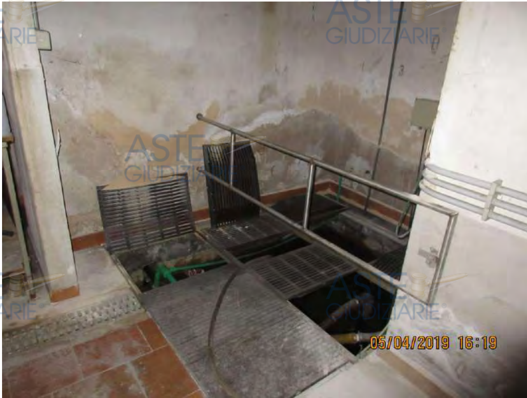
Foto n.55 Pozzo con liquidi e/o reflui delle lavorazioni