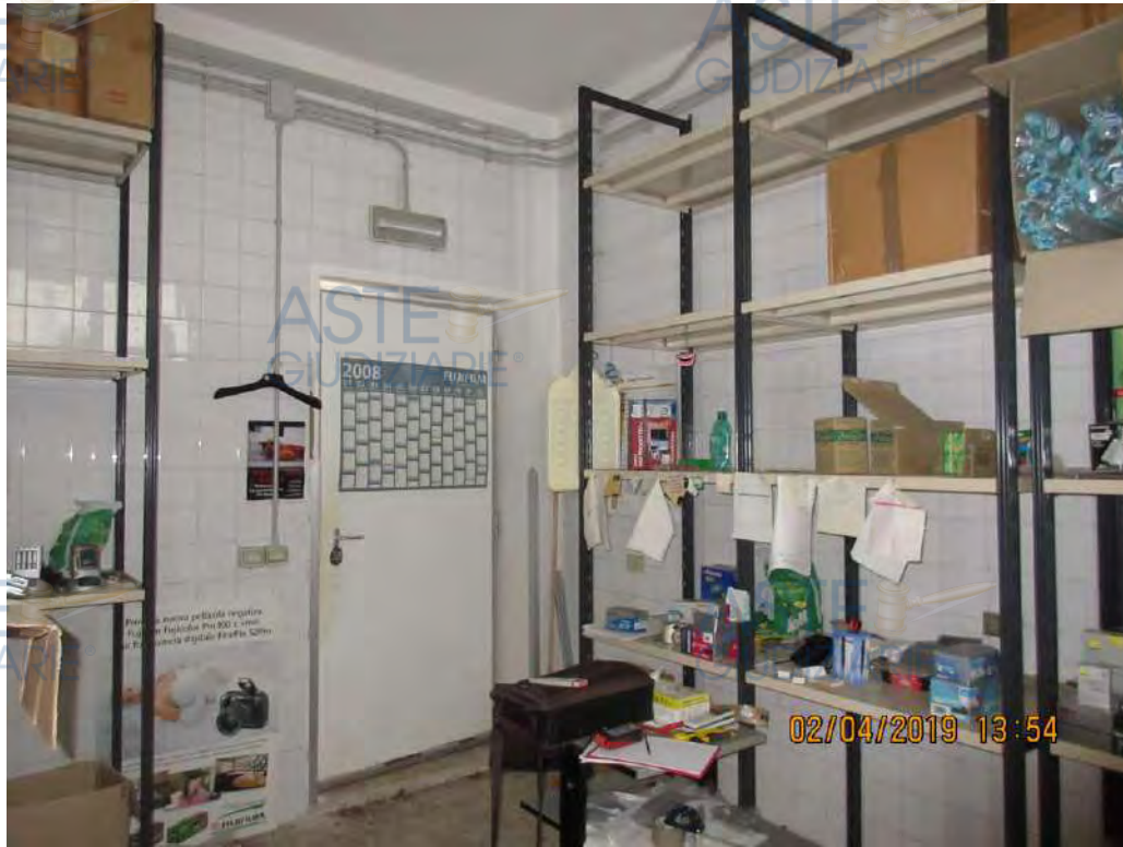
ASTE GIUDIZIARIE Foto n.72