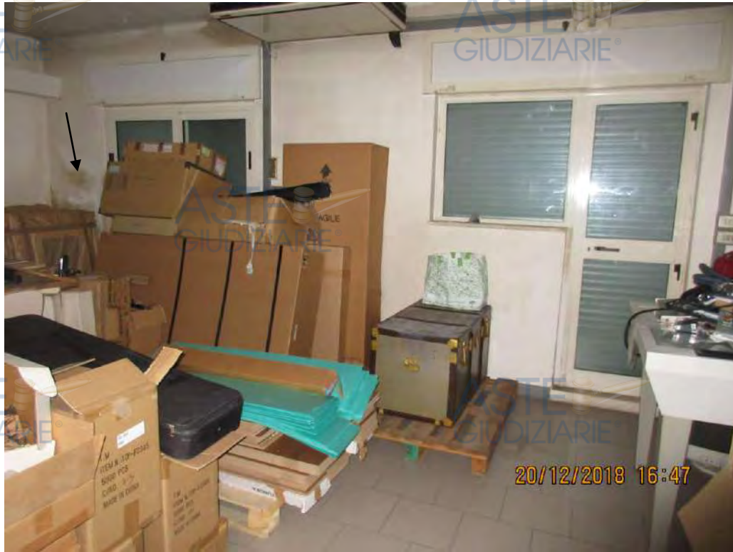
Foto n.40 e 41 Tracce di umidità variamente diffuse