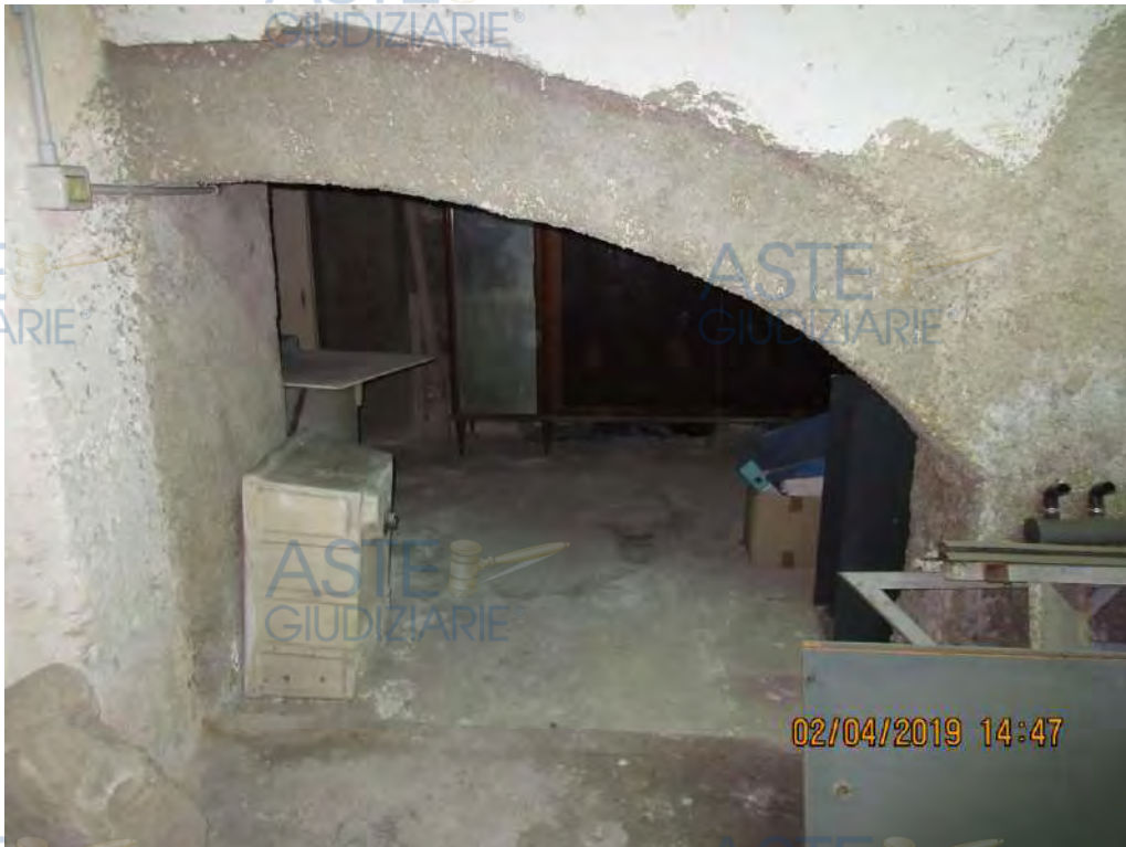
Foto n.86..Varco di collegamento tra i n. 2 locali adiacenti di limitata altezza al massimo di circa 1.50 m in corrispondenza della parete divisoria tra i n. 2 locali