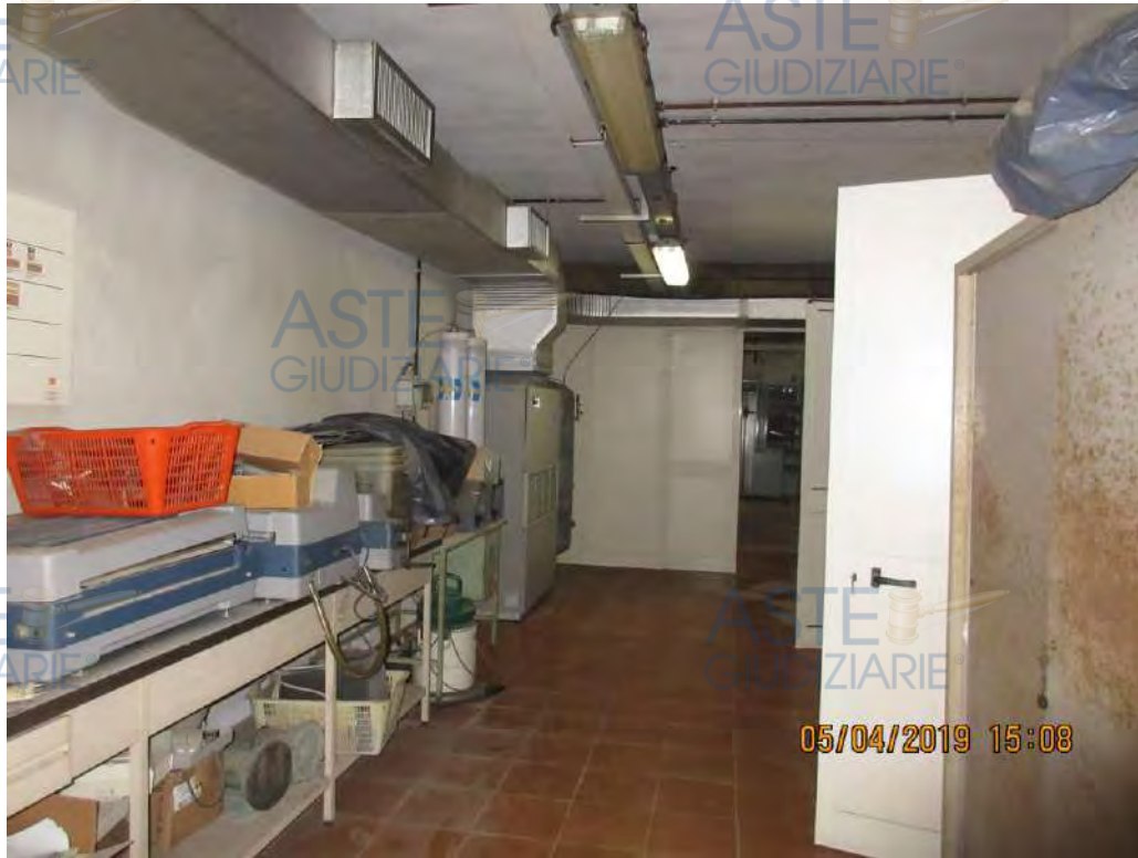
ASTE GIUDIZIARIE Foto n.48