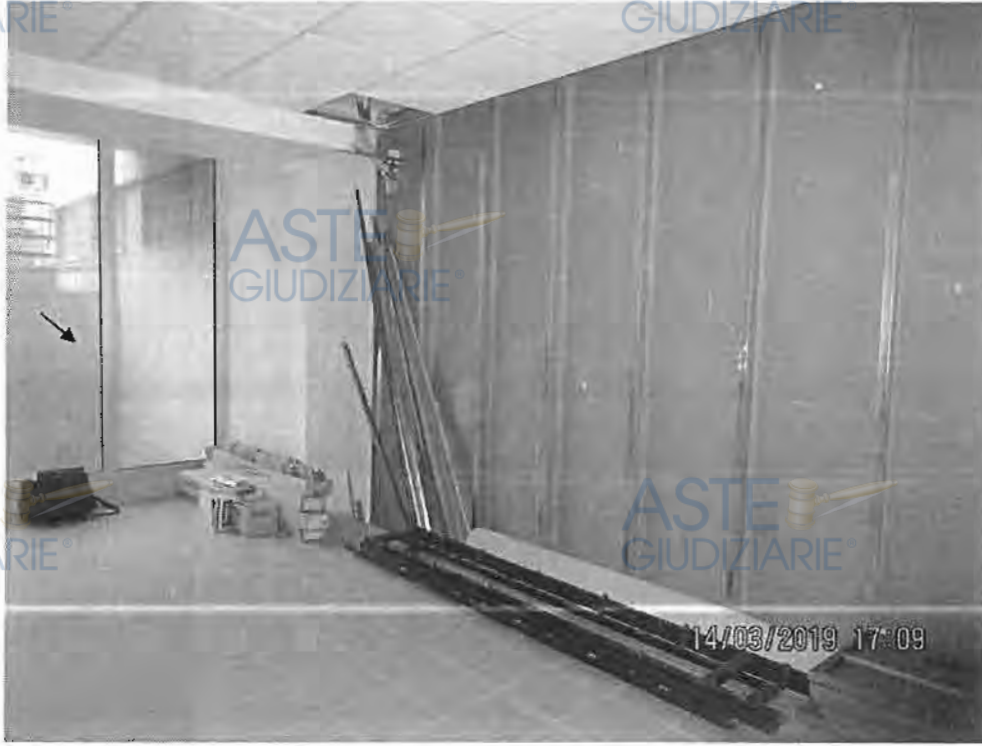
Foto n.4 ; Zona ove esisteva un balcone , inglobato nell'immobile

Lotto n. 4 Valore commerciale rettificato