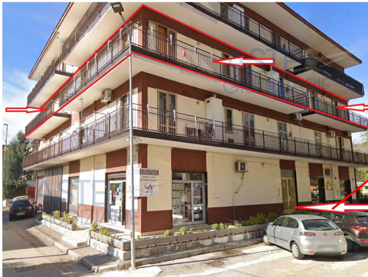
IMMAGINE DELL'AREA OGGETTO DI ESECUZIONE NEL COMUNE DI BAIANO

RIPORTATO NEL N.C.E.U. AL FOGLIO N. XX, PARTICELLA N. XXX