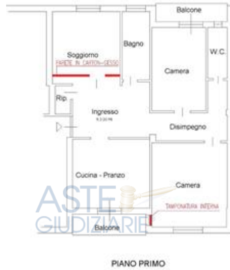
planimetria stato attuale