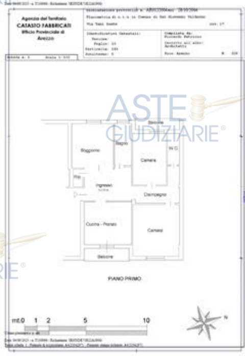
planimetria catastale agli atti