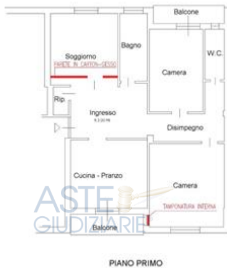
planimetri astato variato

8.3. CONFORMITÀ URBANISTICA: NESSUNA DIFFORMITÀ