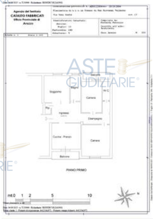
planimetria catastale stato depositato