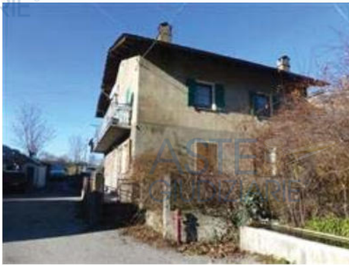
viste esterne immobile principale - 5