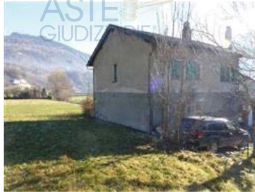
viste esterne immobile principale - 2