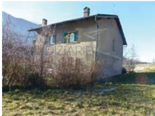
viste esterne immobile principale - 4