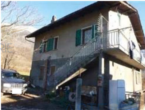
viste esterne immobile principale - 3