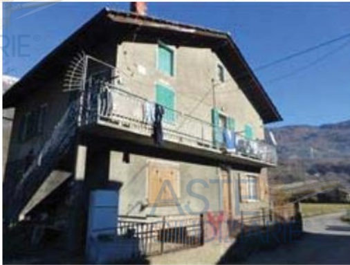
viste esterne immobile principale - 1

L'intero edificio sviluppa 3 piani, 3 piani fuori terra, 0 piano interrato. Immobile costruito nel 1967.