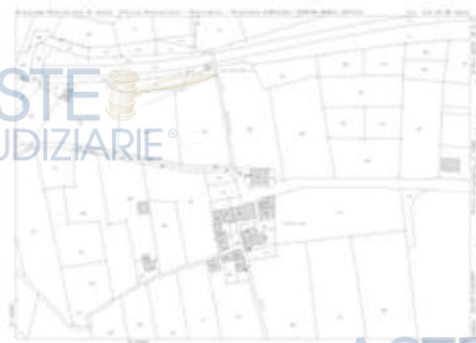
Estratto di Mappa Catastale