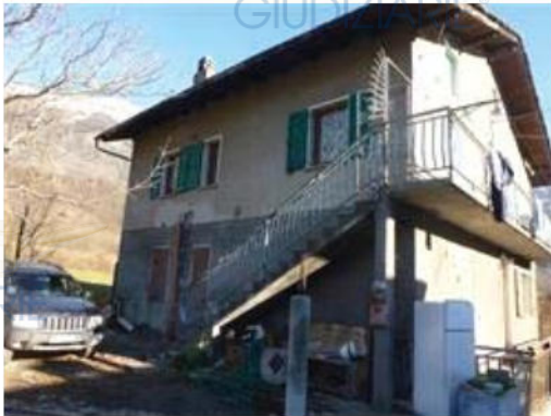
Fabbricato con corte adiacente