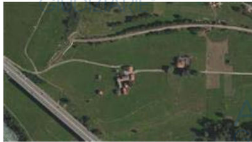
Vista aerea villaggio Le Tous - Saint Vincent