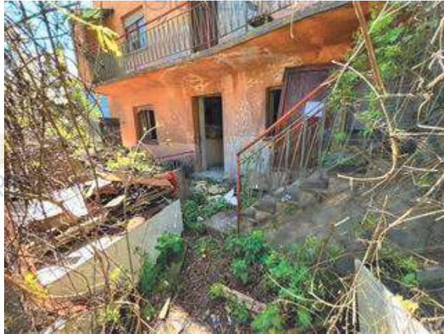
Dettaglio giardino/ente urbano