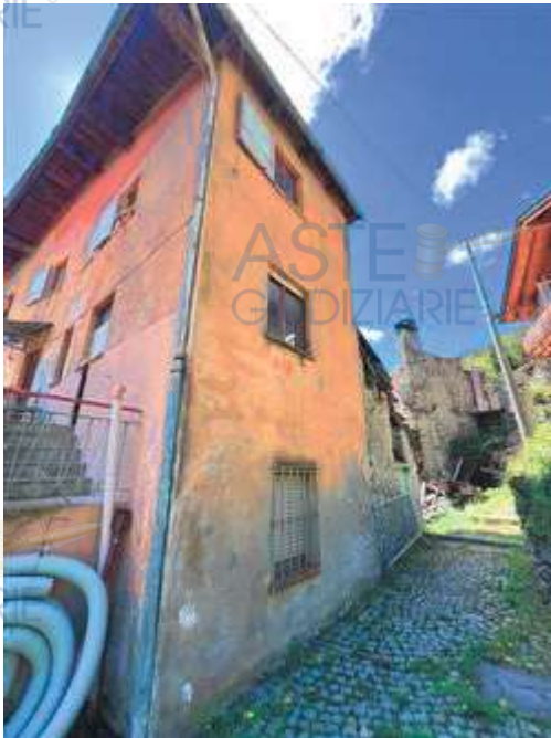
Vista da NORD-EST