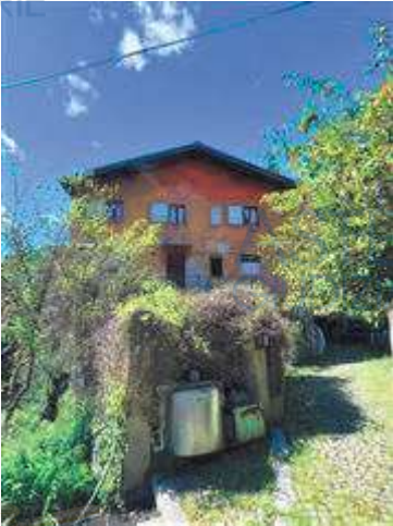
Vista da EST