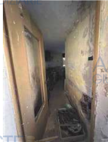
Ingresso locale cucina