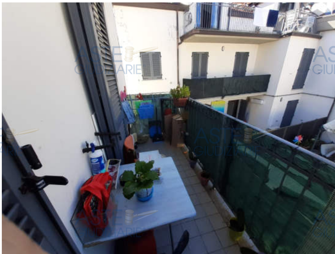
Vista esterna balcone pertinenziale locale cucina – piano terzo