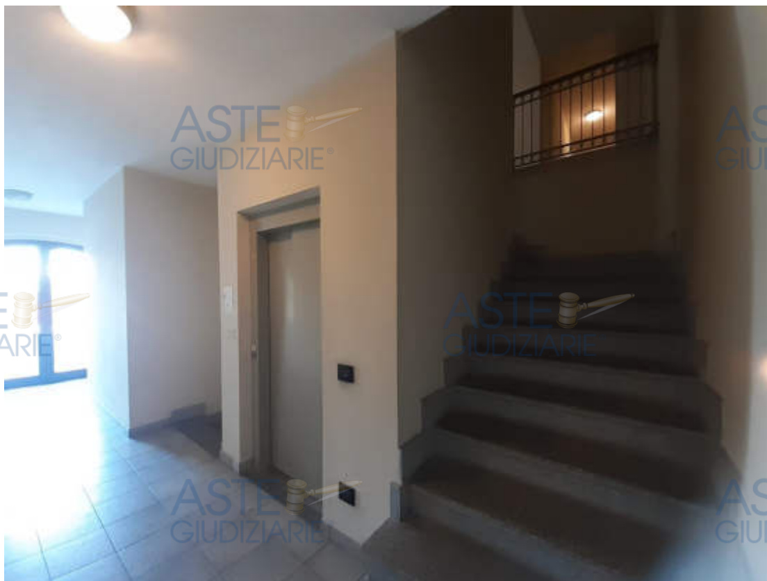
Vista interna dell'androne in piano terra di accesso alla scala condominiale “ C “

Vista strada comunale – Via Roma - di accesso al compendio immobiliare