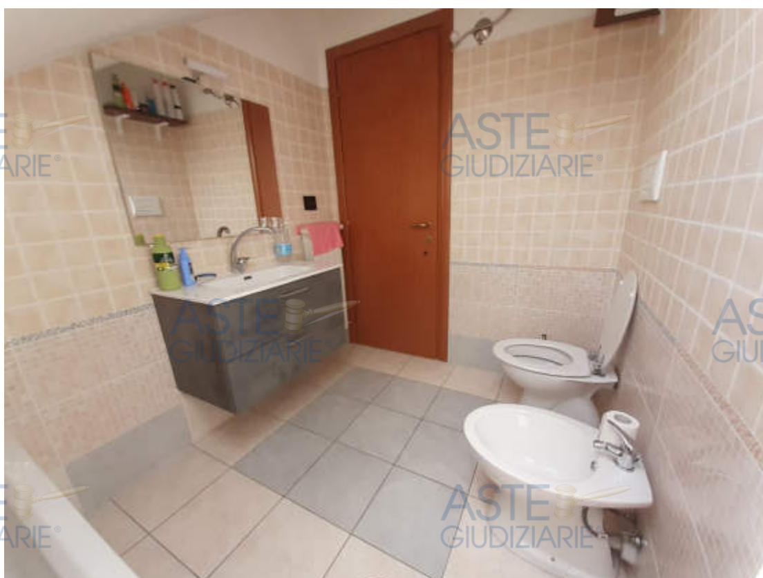
Vista interna locale bagno piano terzo / sottotetto