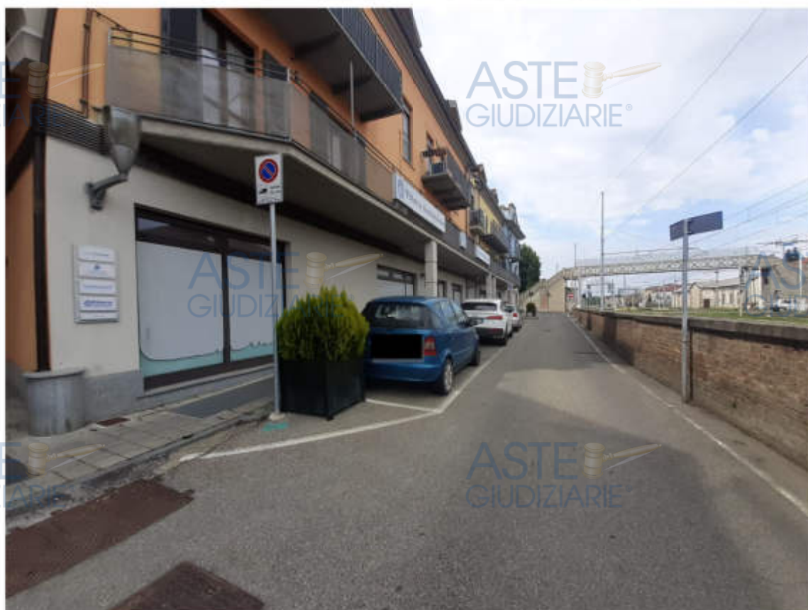
Vista strada comunale – Via San Carlo - di accesso al compendio immobiliare