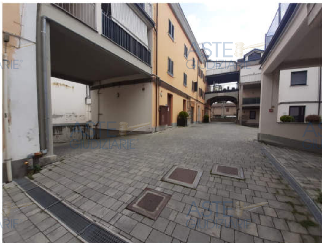
Vista del cortile interno comune alle U.I.U.