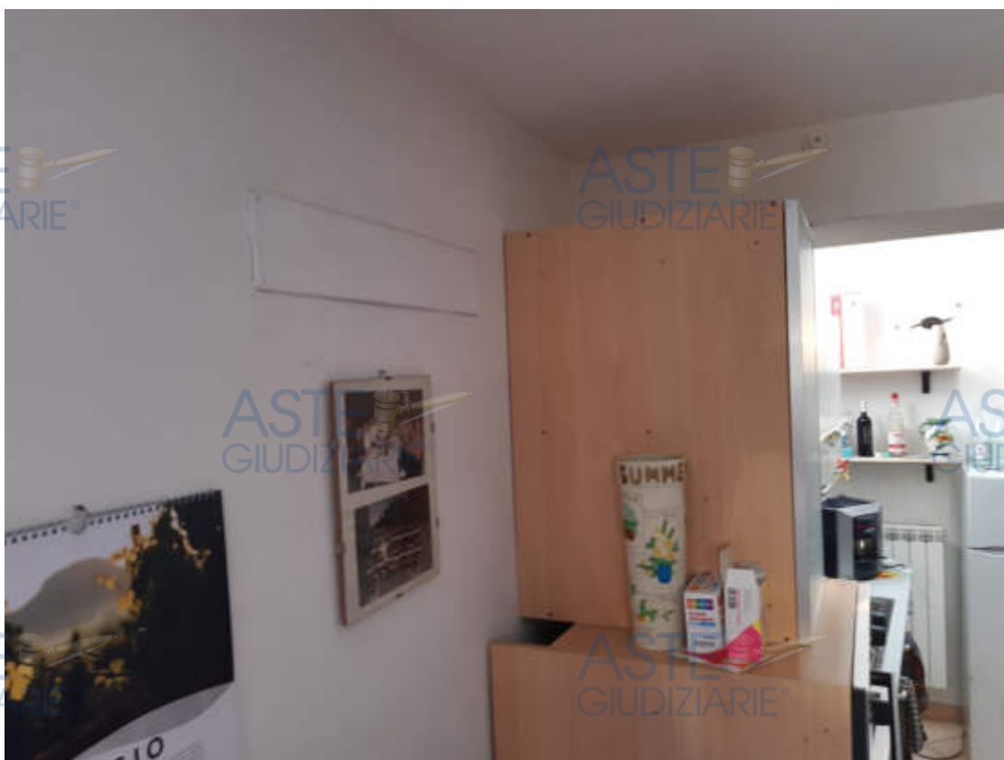
Vista particolare predisposizione impianto climatizzazione