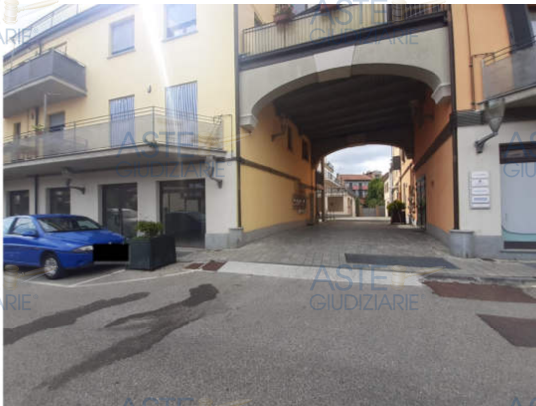
Vista dalla sede stradale di Via San Carlo dell'androne carraio di accesso al compendio immobiliare