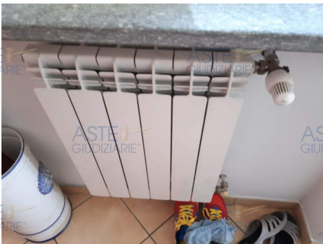
Vista particolare collettore impianto riscaldamento e tipologia termosifoni