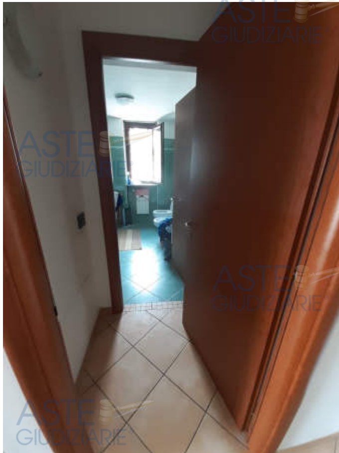
Vista interna locale antibagno piano secondo