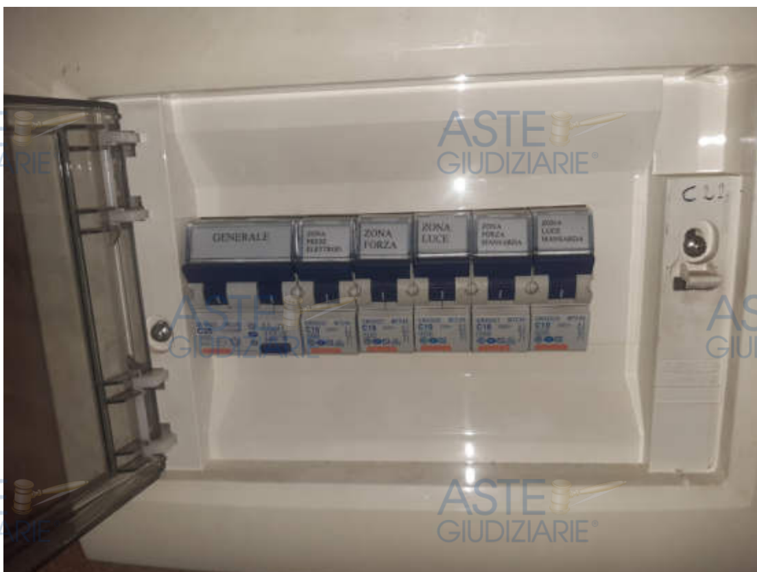
Vista particolare quadretto utenza impianto elettrico