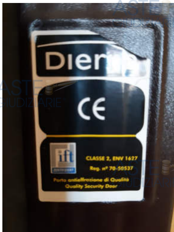
Targhetta descrittiva tipologia portoncino caposcala