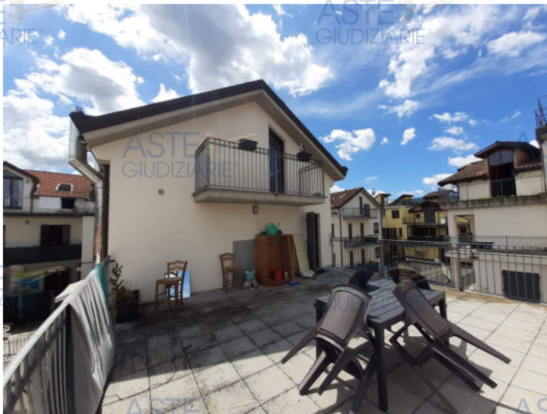
Vista balcone pertinenziale in piano terzo / sottotetto