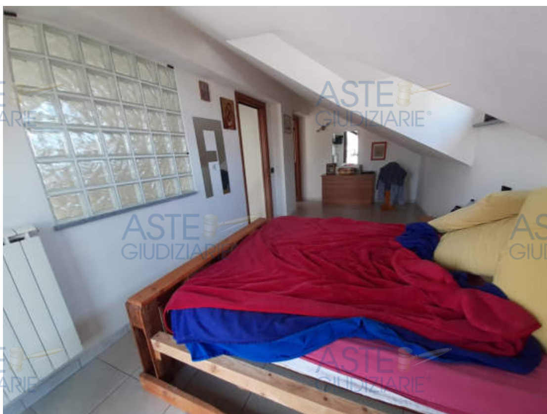
Vista interna locale camera letto piano terzo / sottotetto