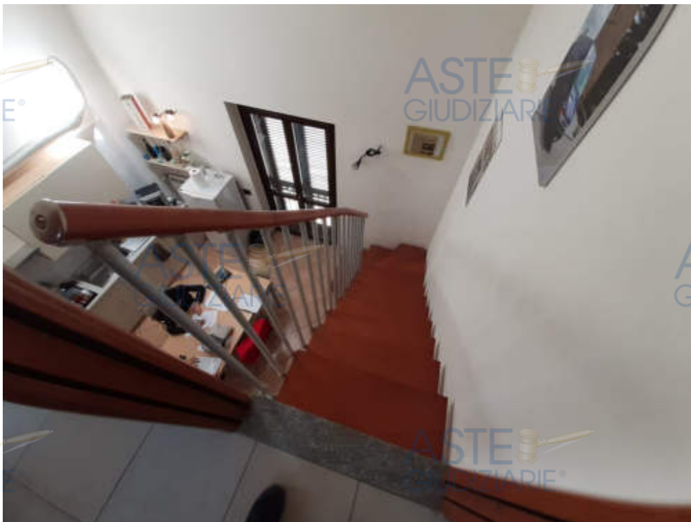
Vista interna scala di collegamento quota piano secondo / terzo sottotetto