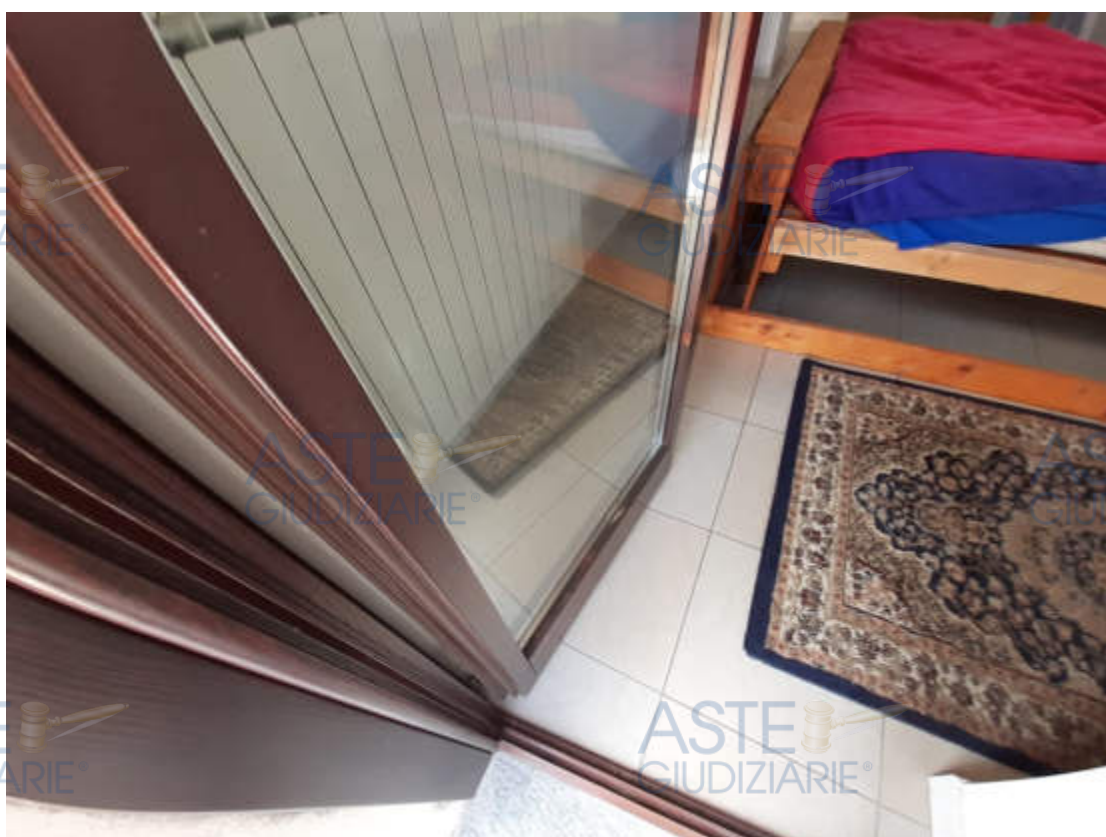
Tipologia serramenti a servizio dei vani abitabili