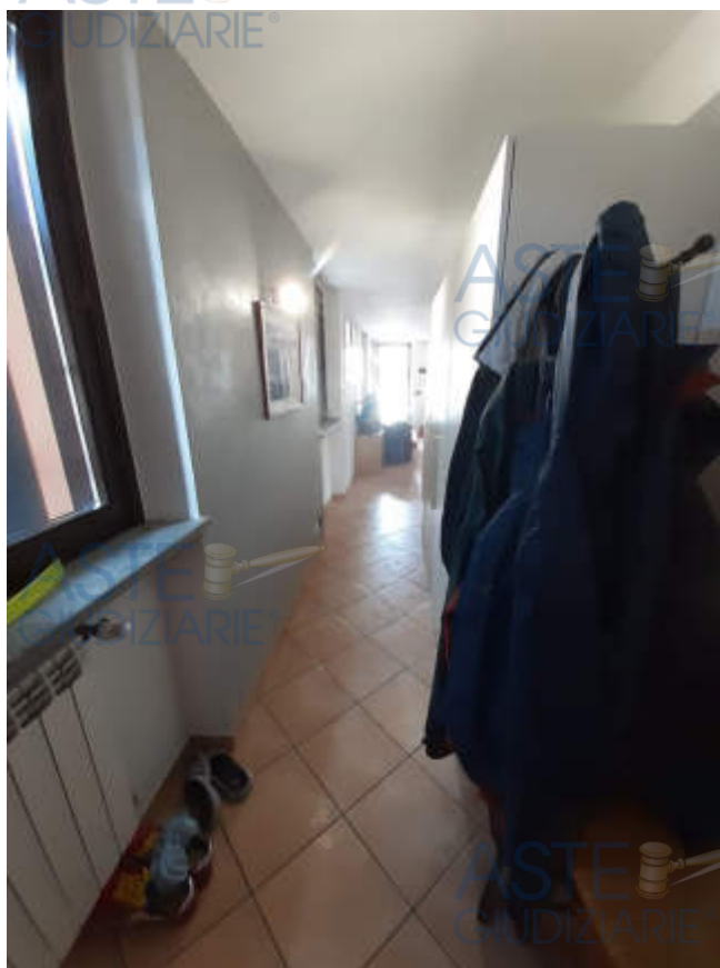
Vista interna del corridoio di ingresso piano secondo