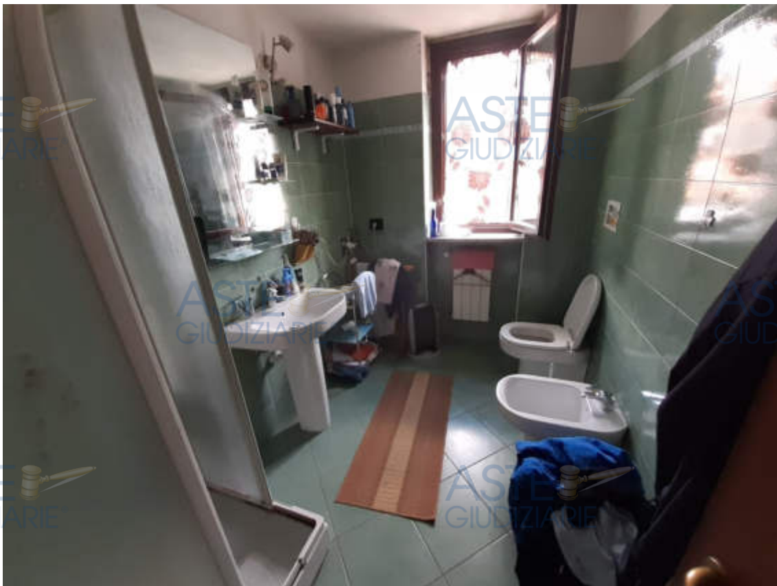
Vista interna locale bagno piano secondo