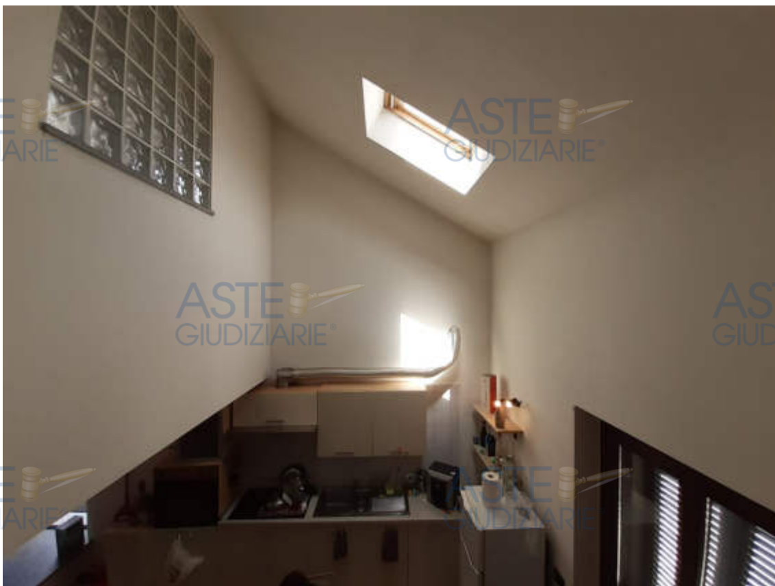
Vista interna locale soggiorno / zona cottura piano secondo