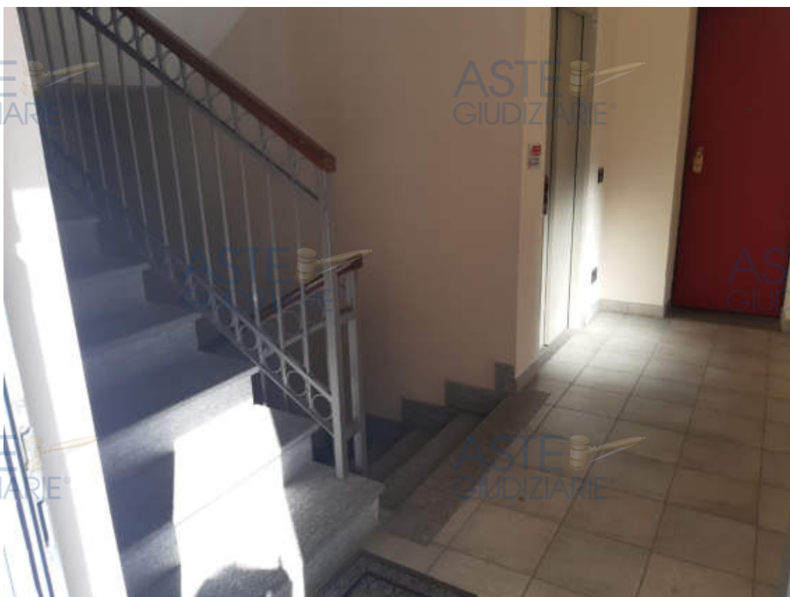
Vista interna dell'androne in piano terra di accesso alla scala condominiale " B "