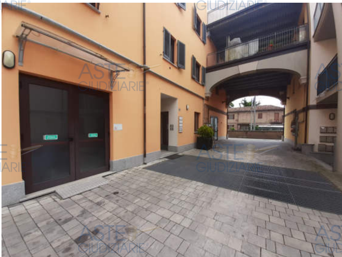
Vista dal cortile interno comune del portone di accesso alla scala condominiale " B "