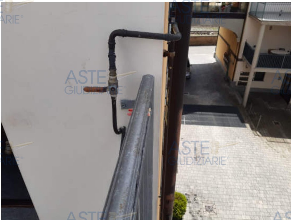
Vista valvola intercettazione impianto gas metano