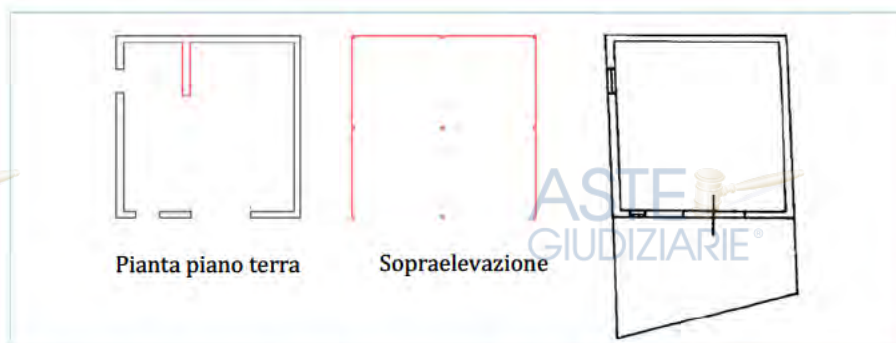
Figure 1 - Confronto tra la restituzione grafica dello stato dei luoghi (a sx al centro) e la Planimetria catastale (a dx).

Dal confronto tra planimetria catastale e restituzione grafica dei rilievi metrici, figure 1, si evidenzia la realizzazione di un muro sul lato Nord del fabbricato e la realizzazione di una sopraelevazione in struttura precaria adibita ad uso deposito.