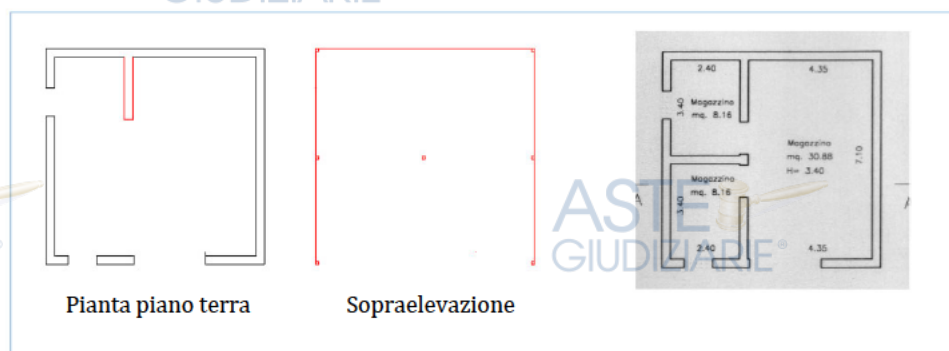
Figure 2 – Confronto tra la restituzione grafica dello stato dei luoghi (a sx il p Terra e la sopraelevazione) e gli elaborati grafici allegati al titolo autorizzativo (a dx piano Terra).

Il fabbricato è stato realizzato senza le prescritte autorizzazioni di legge e in data 29/10/1997 è stata presentata al fine di sanare l'abuso per il bene in oggetto la richiesta di condono edilizio registrata al protocollo generale del comune in pari data al n. 1297 ed al registro delle domande di concessione al n. 100. Successivamente il comune di Naro ha rilasciato in data 10/02/1999 la concessione edilizia in sanatoria n. 7/2000 ai sensi e per gli effetti dell'art. 13 della Legge del 28/02/1985 n. 47. Dal confronto tra la restituzione grafica dei rilievi metrici e gli elaborati grafici allegati al titolo autorizzativo, che si riportano nella figura 2, si evidenzia la realizzazione di un muro sul lato Nord del fabbricato, la demolizione dei muri che delimitavano il vano posto sul lato Sud e la sopraelevazione di un altro piano realizzato con una struttura precaria in lamiera.