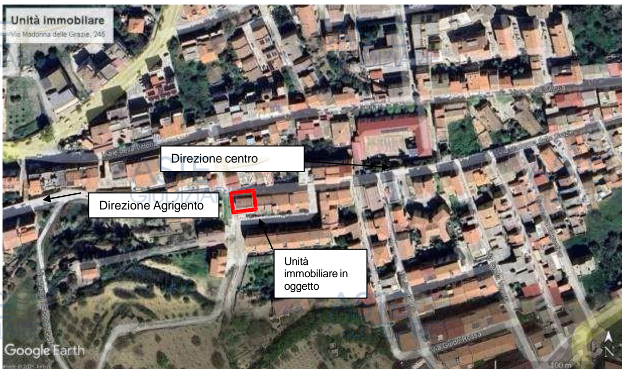
Fig. 1 – zona di ubicazione dell'immobile all'interno del centro abitato di Grotte (AG)

L'unità immobiliare oggetto dell'esecuzione immobiliare, fa parte di un fabbricato composto da n° 5 livelli fuori terra, l'accesso avviene dalla via Madonna delle Grazie, 245, per mezzo di una scala condominiale si raggiunge l'appartamento, dotato di ascensore.