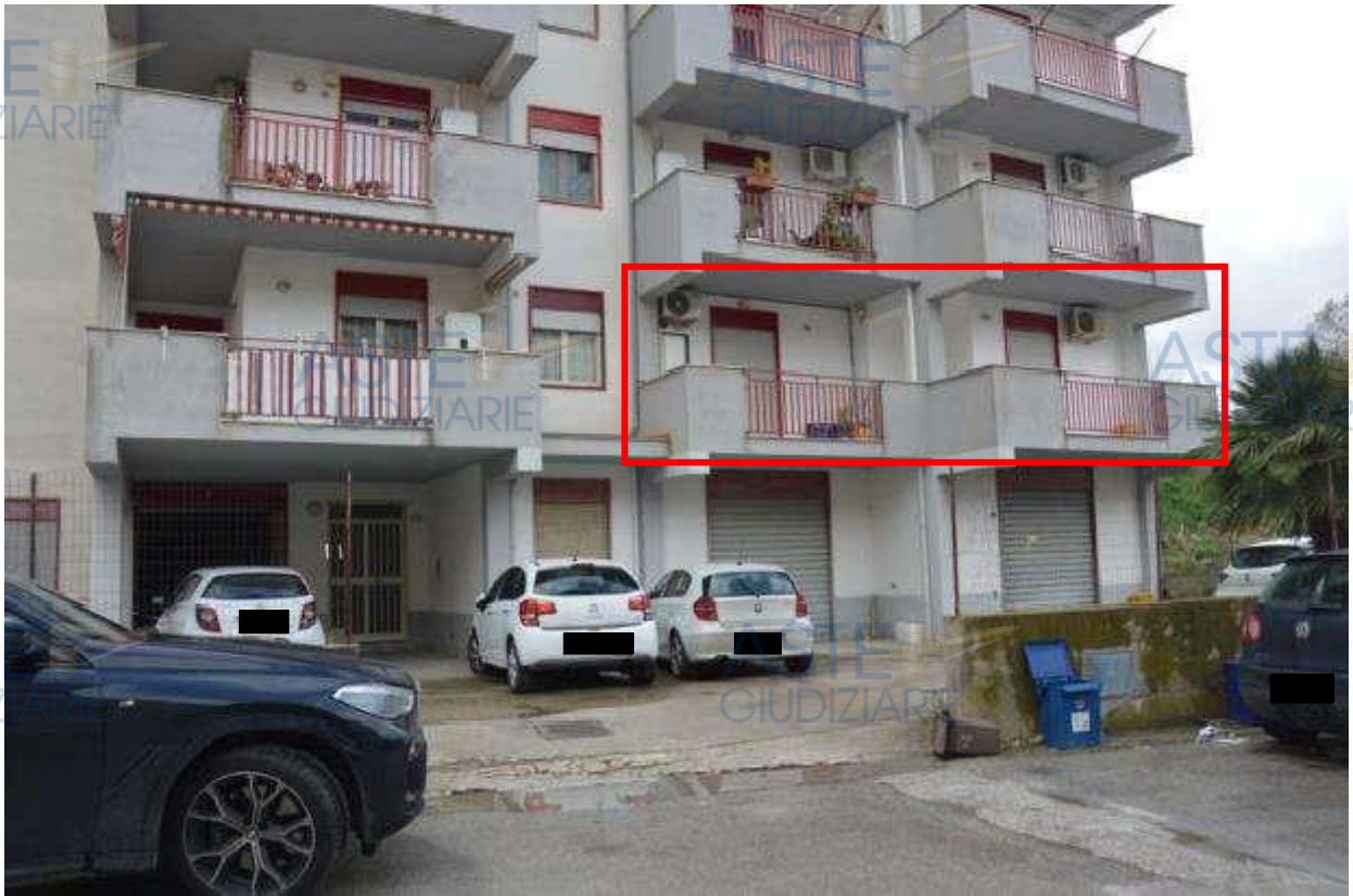
Figura 1 - fg. 16 - part. 1237 – Sub. 34 - Ingresso Lotto