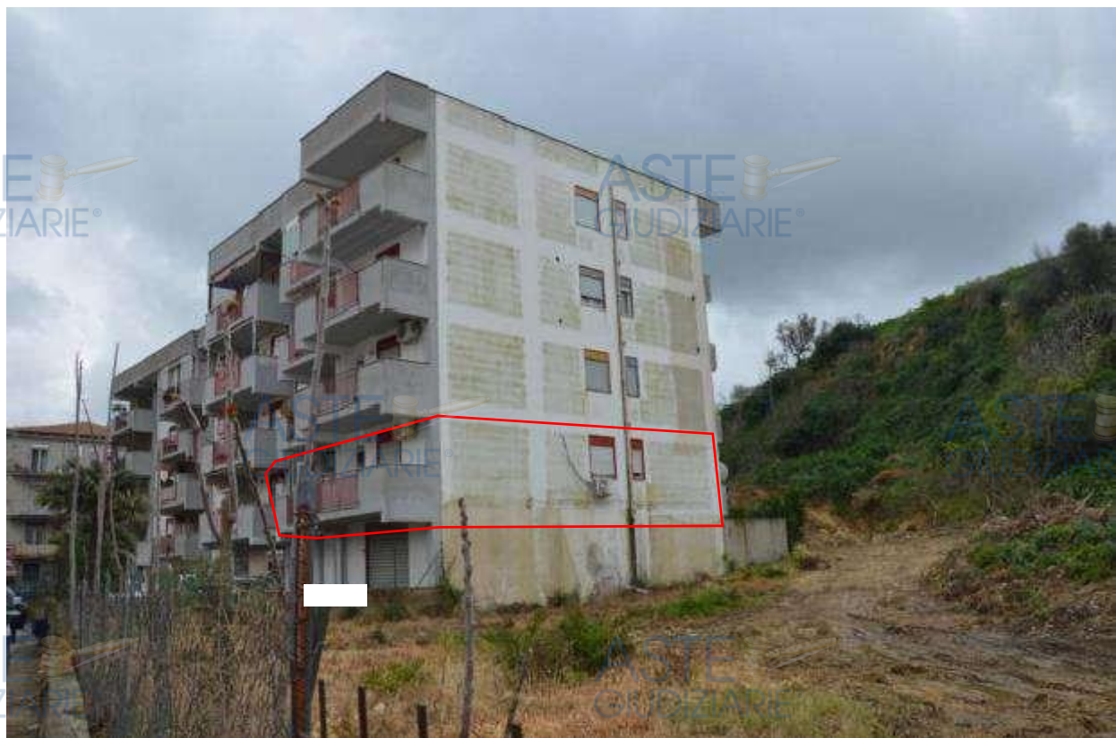
Figura 2 - fg. 16 - part. 1237 – Sub. 34 – Prospetto laterale ovest