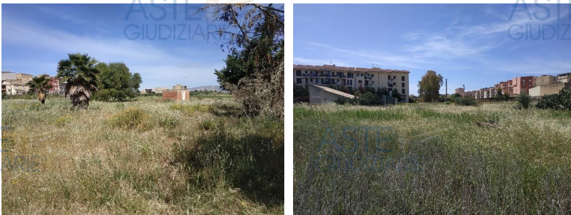
Figura 3 - Vista Terreno