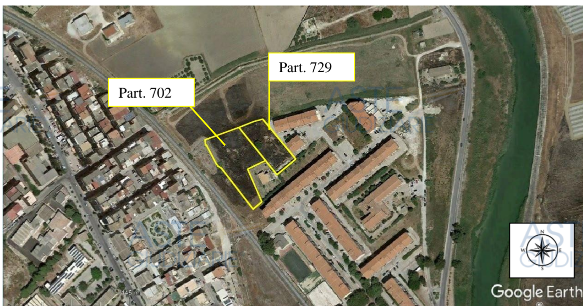
Figura 1 - Individuazione di massima del lotto

La figura 1 riporta l'ortofoto del terreno.