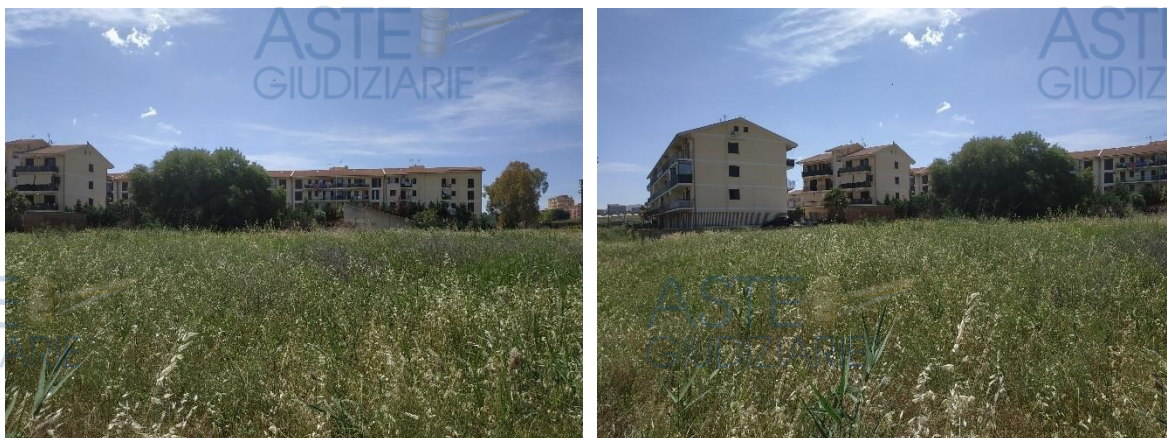
Figure 2 – Vista Terreno

Le figure 2 – 3 riportano parte del rilievo fotografico, la figura 4 il particolare del locale tecnico ed il relativo rilievo metrico.