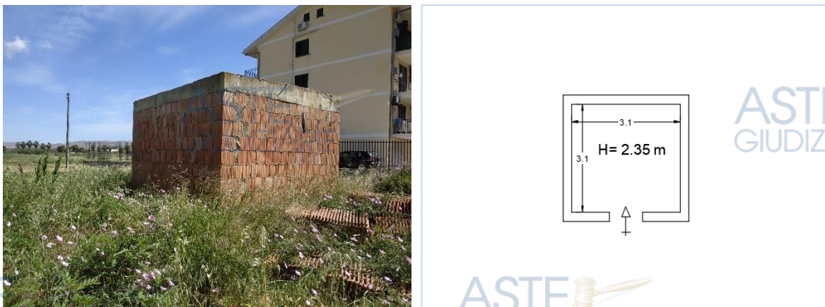
Figure 4 – A sx il particolare fabbricato a dx il relativo rilievo metrico