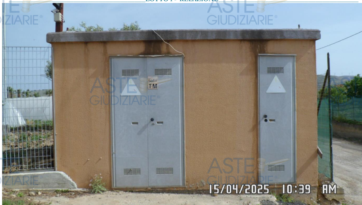
Figura 3 – Vista della cabina elettrica.