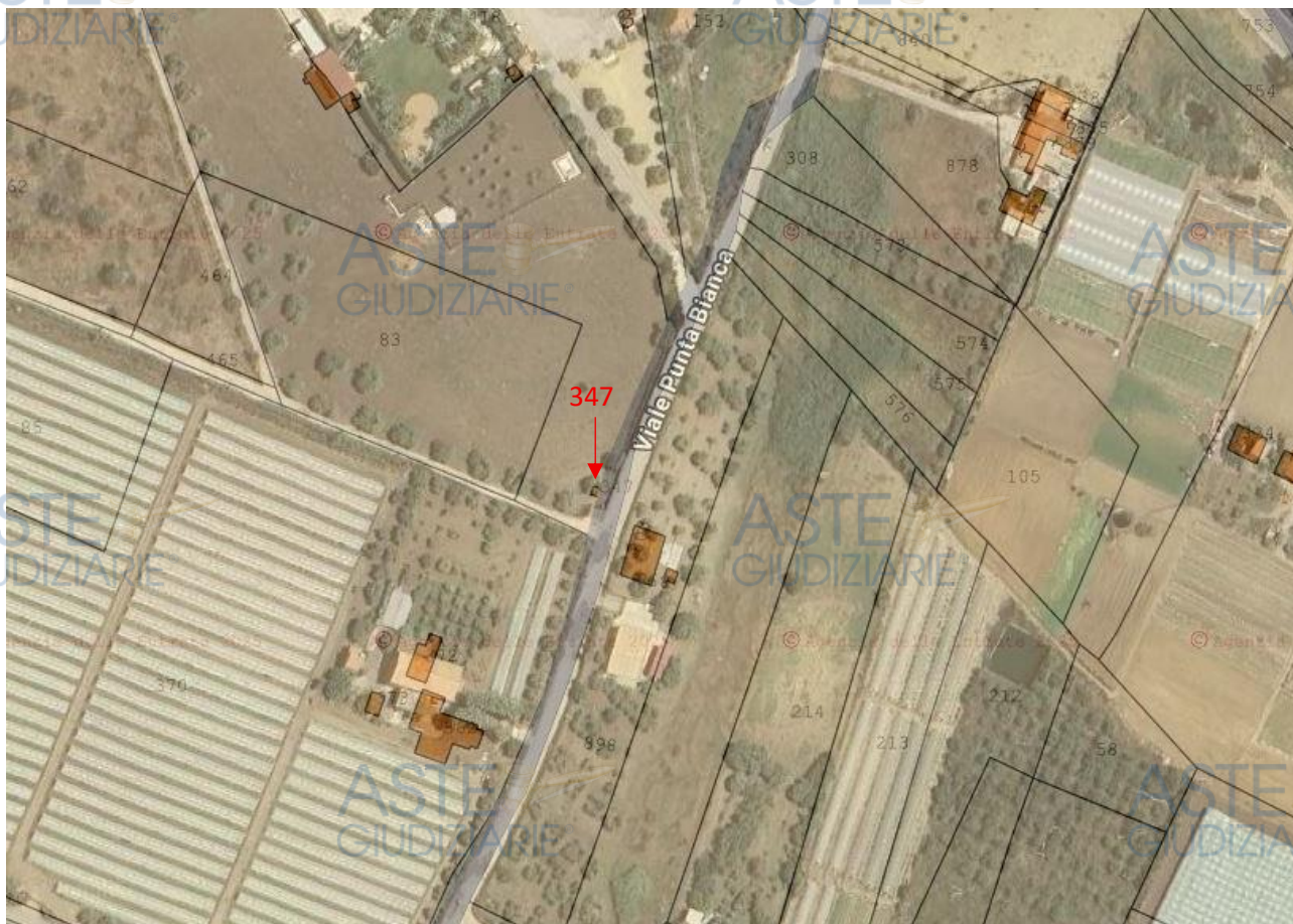
Figura 2 – Sovrapposizione di catastale su ortofoto.