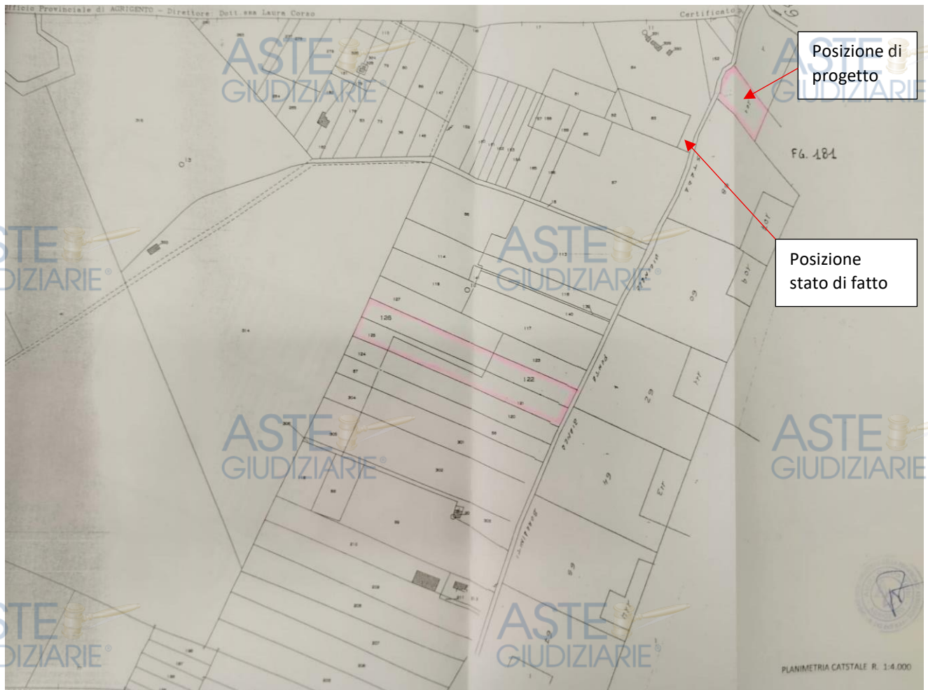
Planimetria allegata alla richiesta di autorizzazione.

Esiste autorizzazione n. 412/08 rilasciata il 15/12/2008 dal Comune di Agrigento alla ditta "B" per la collocazione di n. 2 strutture prefabbricate, una di consegna e misura, l'altra di smistamento e connessione, in dei lotti di terreno privati. La cabina di smistamento non è stata posizionata come da autorizzazione.