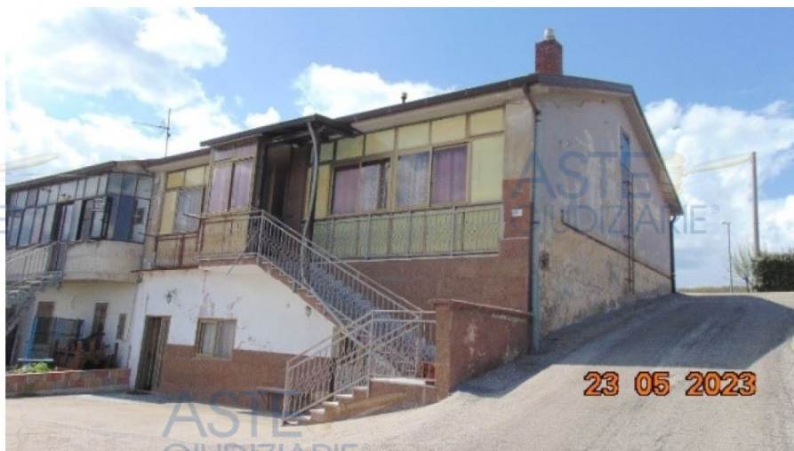
Lotto 3 – Foto n. 1 (Scala esterna di accesso all'abitazione)