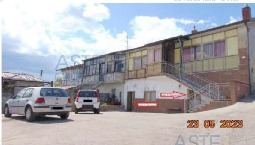
Lotto 2 – Foto n. 1 (Area di pertinenza e accesso)