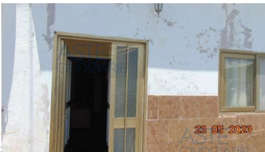
Lotto 2 – Foto n. 2 (Ingresso abitazione)