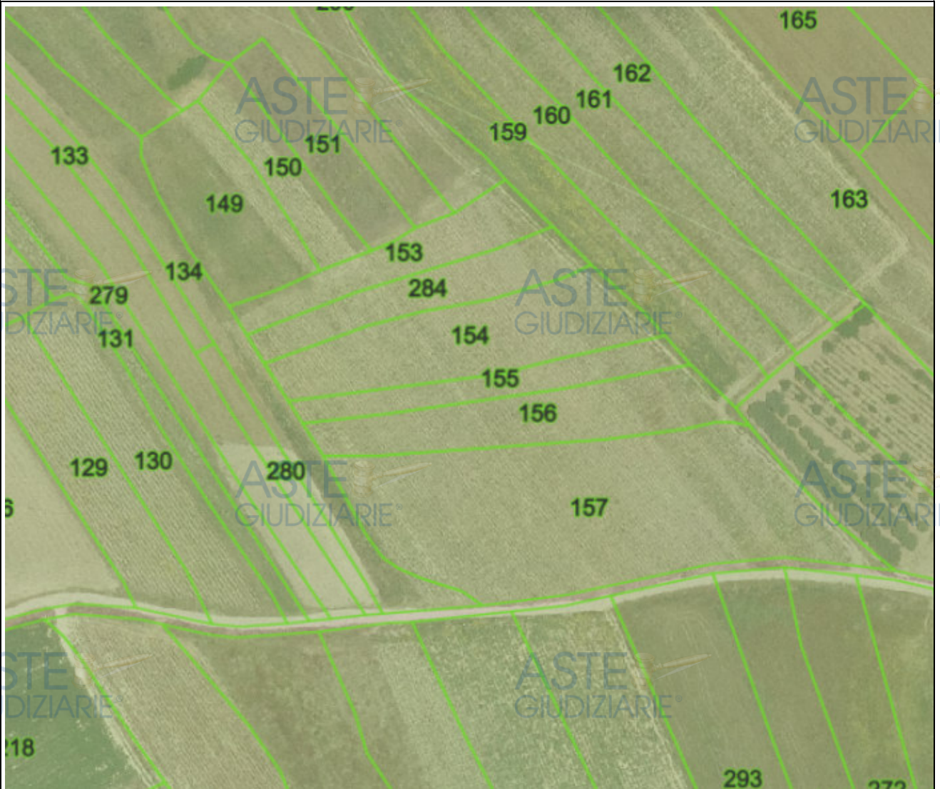
LOTTO N° 2 FOGLIO 16 MAPPALE 284