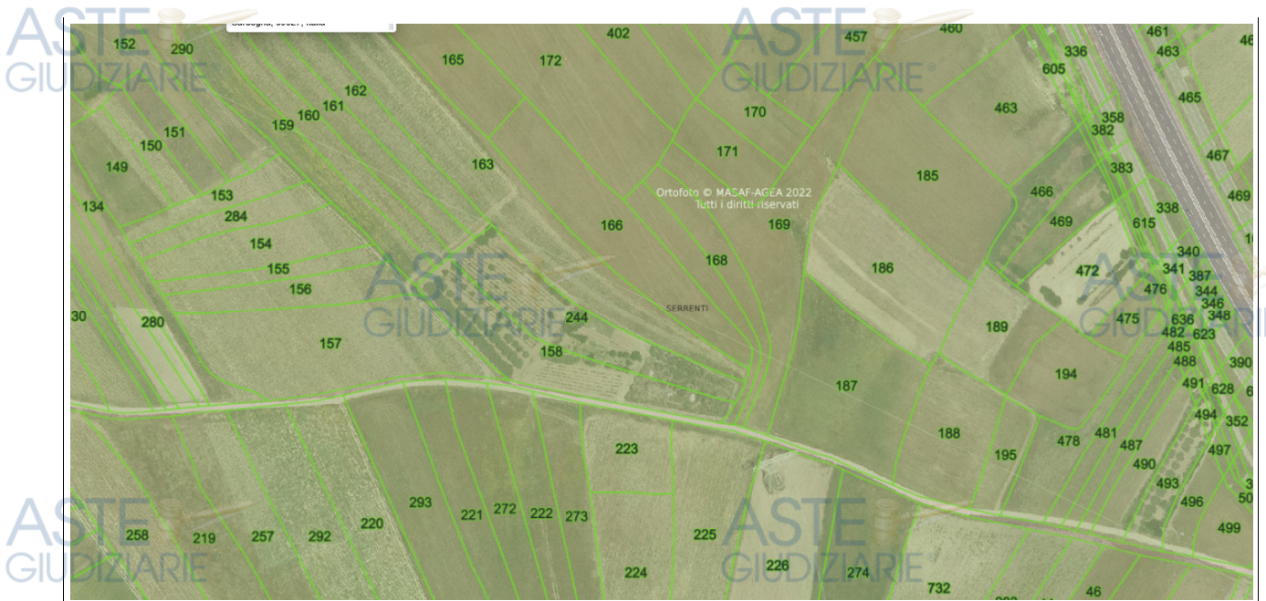
LOTTO N° 2 FOGLIO 16 MAPPALE 481 – 284