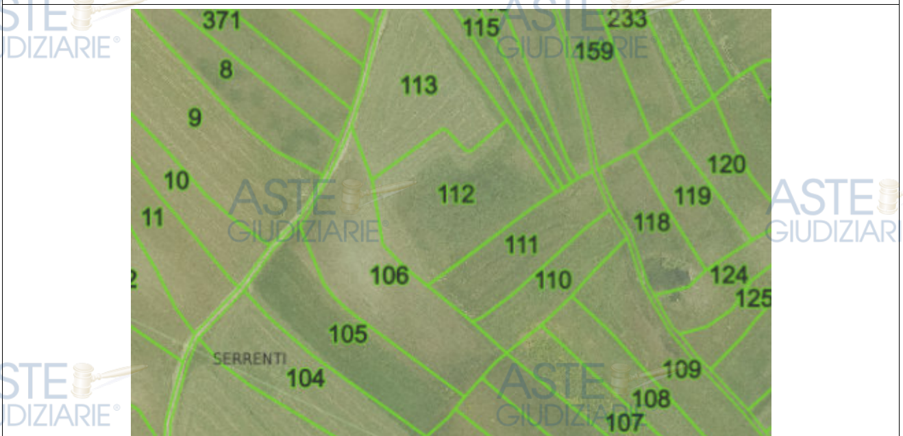
LOTTO N° 1 FOGLIO 12 MAPPALE 110