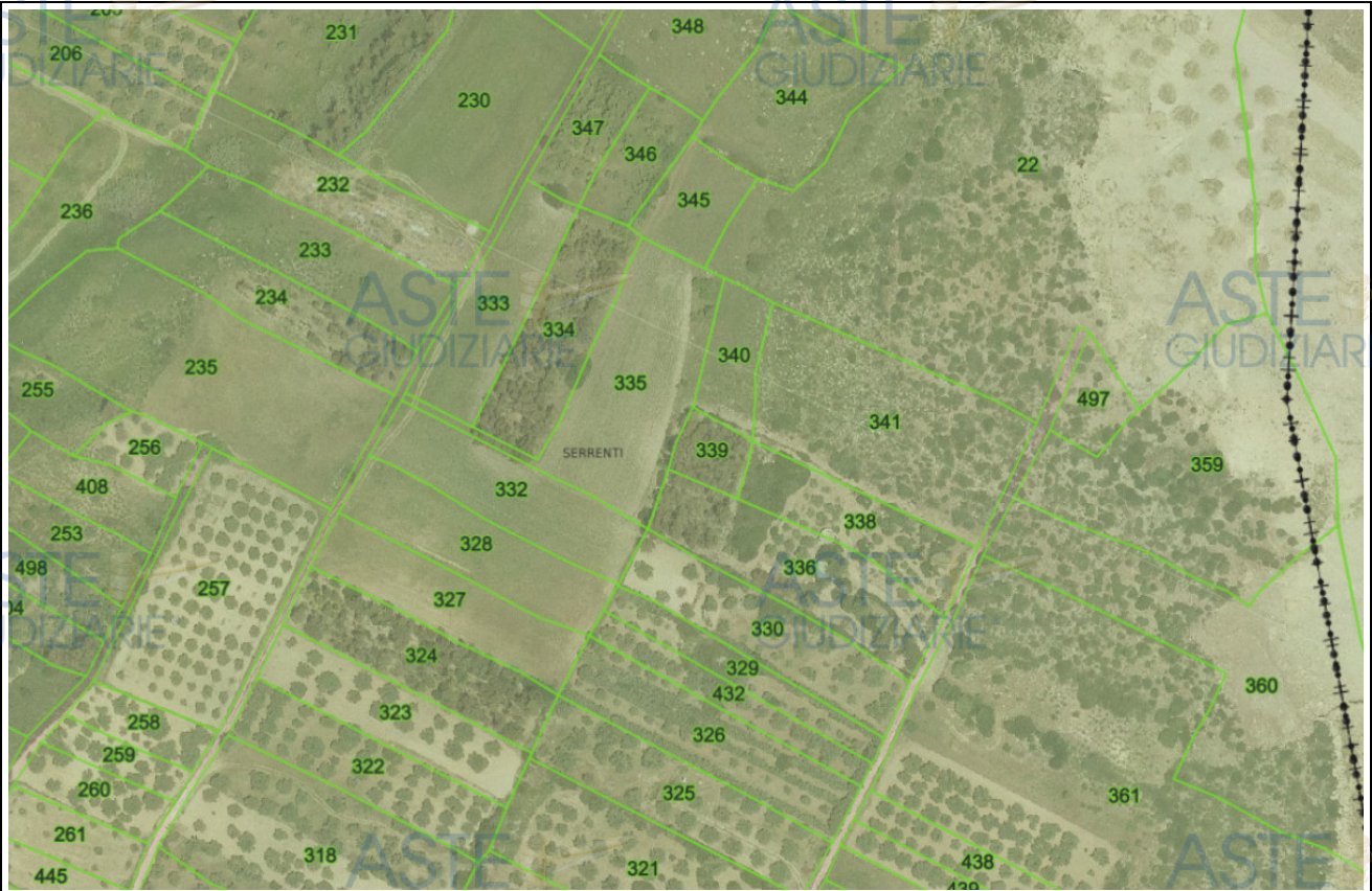
LOTTO N° 4 FOGLIO 19 MAPPALE 340-341