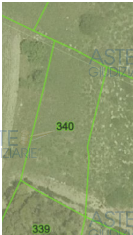
LOTTO N° 4 FOGLIO 20 MAPPALE 340