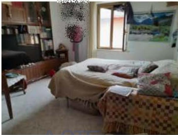
Stanza da letto