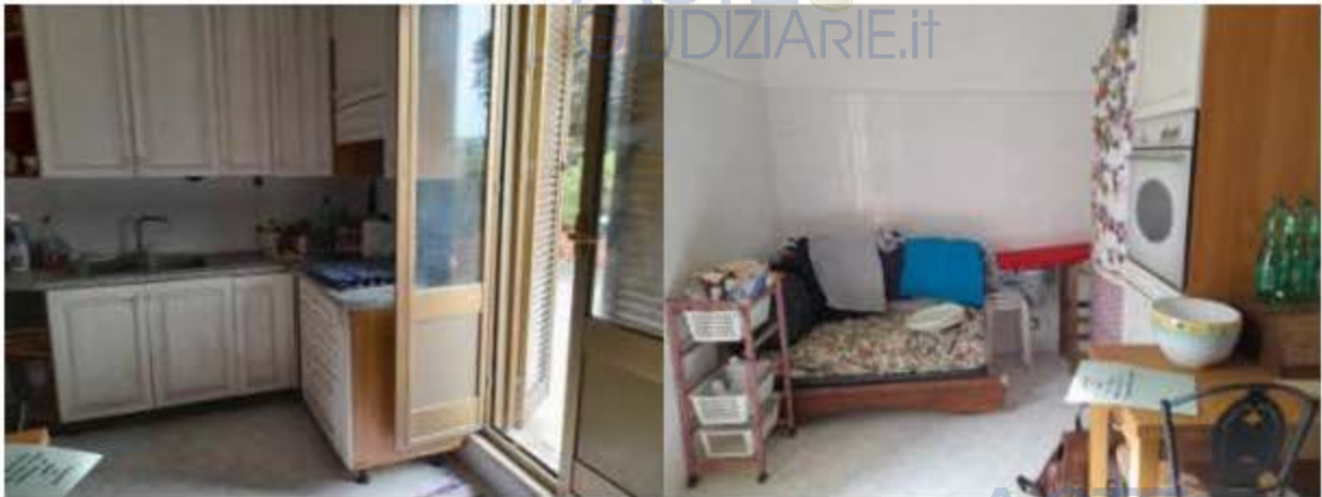
Soggiorno con angolo cottura

Dal portoncino d'accesso dell'appartamento si entra direttamente nel corridoio su cui si affacciano tutti gli ambienti che compongono l'appartamento, con distribuzione originaria come da planimetria d'impianto, stanza da letto soggiorno/ cucina con terrazzo prospiciente e servizio igienico.